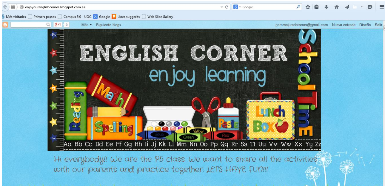
Figura 1. Blog de clase Enjoy our English Corner (Elaboración propia)

Las actividades propuestas están pensadas para que los alumnos participen activamente en su aprendizaje. Los niños/as son los protagonistas, ya que la mejor forma de aprender es realizando las actividades de una forma totalmente activa. Las tareas son principalmente individuales (para poder desarrollar su autonomía), pero en clase también se proponen actividades de carácter grupal para desarrollar sus competencias sociales (colaboración con los compañeros).