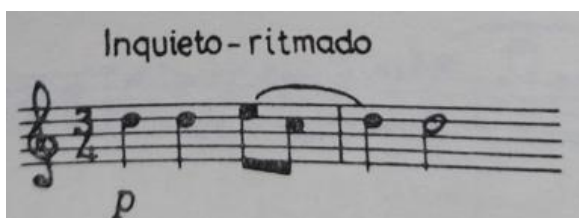
Figura 1. Célula temática de Gitano

La forma estructural de la pieza sigue un esquema ABA, lo que proporciona un marco claro y equilibrado para su desarrollo. El primer período presenta una subdivisión interna a-b-a, compuesta por frases de 12, 25 y 12 compases respectivamente, todas introducidas por el mismo motivo temático.