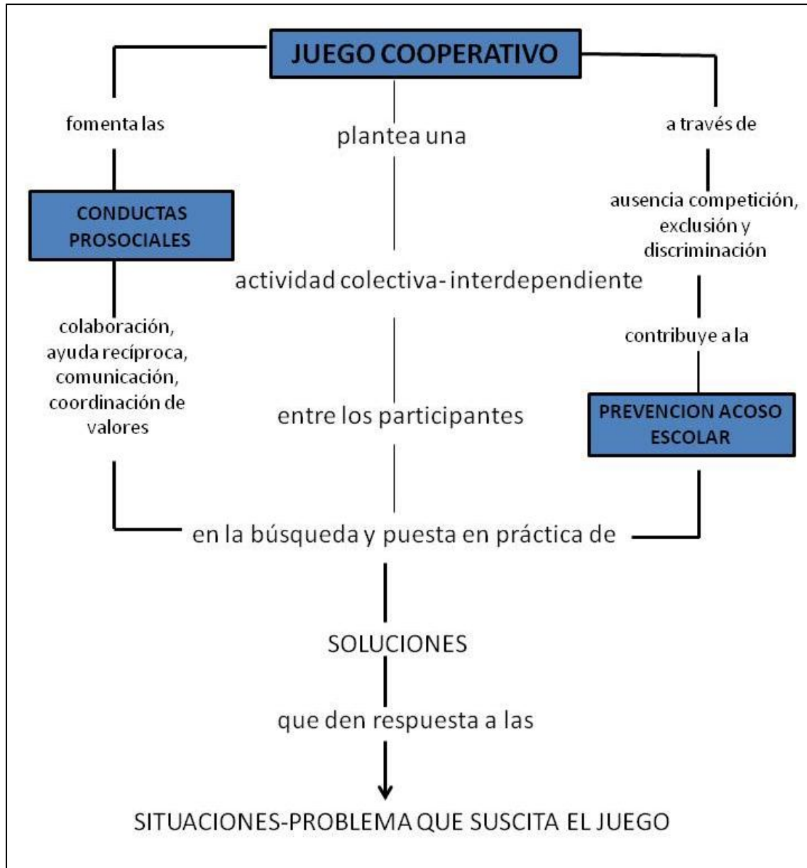
Figura 2. Mapa cognitivo: el juego cooperativo (Elaborado a partir de Ruiz y Omeñaca, 2005).

La situación lúdica presentada a través de los juegos cooperativos supone una ocasión excelente para la adaptación social en la que el niño entra en interacción con el resto de compañeros. Se consigue el fomento de la prosocialidad al posibilitarle tanto las relaciones interpersonales como, el mantenimiento de su salud y bienestar consigo mismo. Por ello, el fortalecimiento de conductas prosociales con este tipo de intervenciones son esenciales suponiendo un factor clave para el desarrollo de la competencia social, aspecto vital en la prevención de acoso entre iguales.