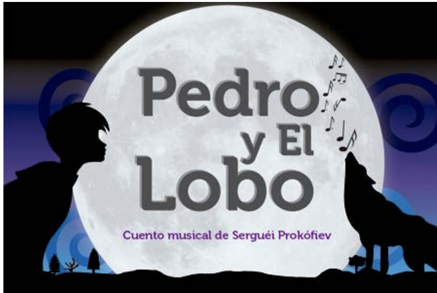
Figura 2. Portada del cuento Pedro y el lobo (Prokofiev, 1936).