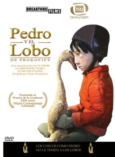
Figura 3. Ilustración del cortometraje Pedro y El lobo.

La actividad va a consistir en la lectura del cuento por parte del docente y la visualización del cuento a través de la pizarra digital (ver materiales propuestos en el capítulo de Referencias Bibliográficas). Una vez que escuchen y vean el cuento musical, pasaremos a aclarar conceptos a los alumnos. En primer lugar, debe explicarse qué es un cuento musical, qué es una orquesta, cuántos instrumentos hay en una orquesta, cuáles son, principales nombres, etc.