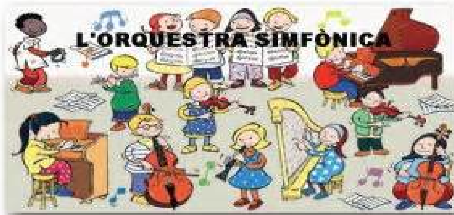
Figura 6. La orquesta sinfónica.