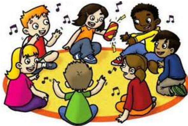
Figura 5. Disposición del alumnado en la sesión. Fuente: www.gciforillustration.com