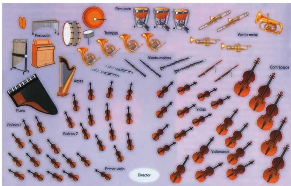
Figura 4. Diferentes instrumentos presentes en una orquesta.

Basándonos en los instrumentos que aparecen en el cuento, en esta actividad se plantea conocer cada instrumento y su sonido. Los instrumentos serán facilitados por el aula de música, bien en formato póster, fotografía, instrumento original y su audición. Con la ayuda del profesorado de música, se hará una sesión de escucha atenta de los instrumentos musicales considerados protagonistas del cuento.