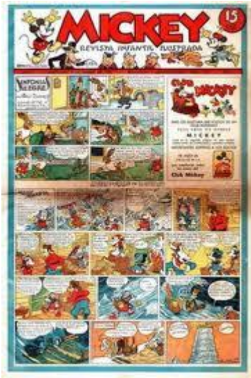
Cómic de Mickey