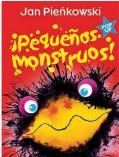
Libro de juego o Pop-ups