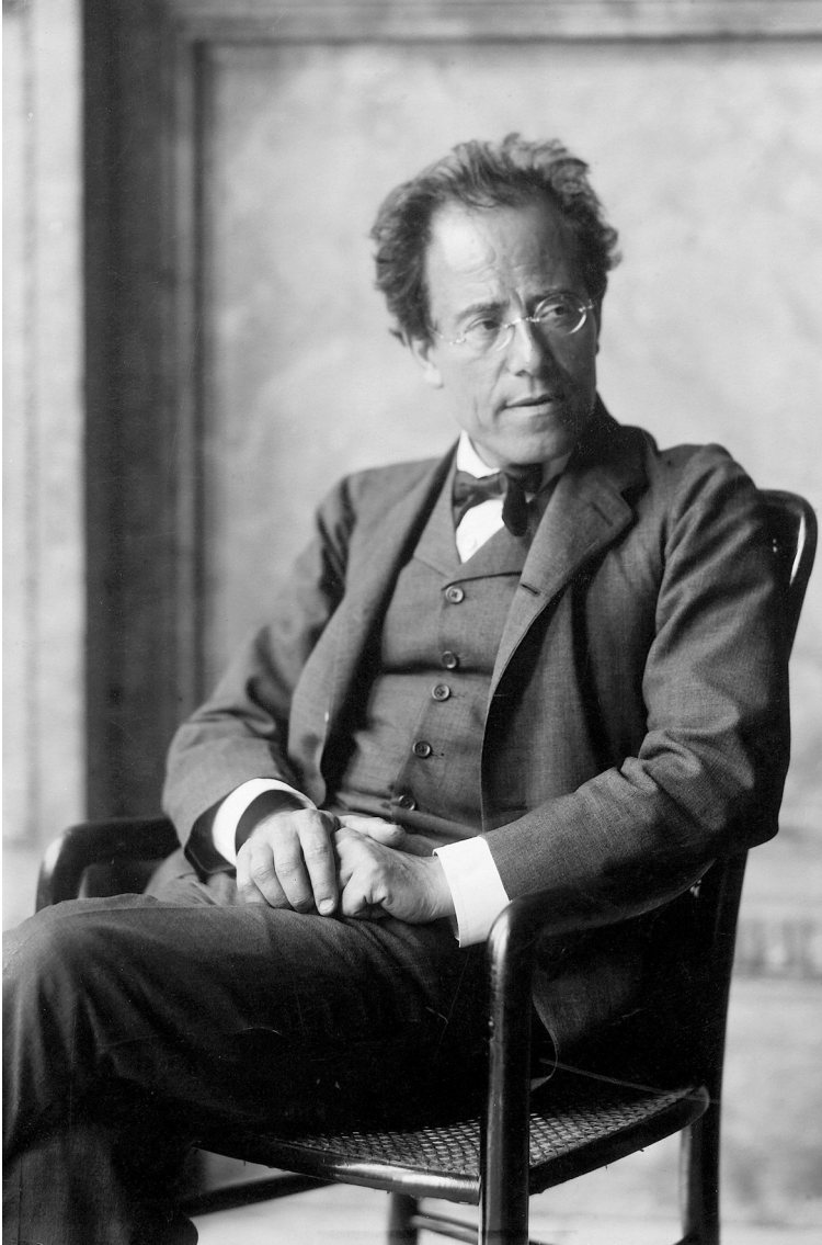
Gustav Mahler, 1907. Photo Moritz Nähr © Österreichisches Theatermuseum.