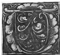
1534-1545 Tavera. Evangelario (ACT, ms. 56-11, s.f.)