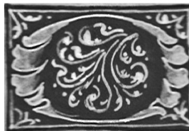
1539 Tavera. Constitutiones (ACT 9, f. 2v)