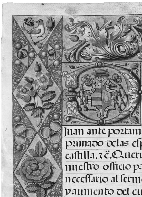
Fig. 7.1. Juan Pardo Tavera, Constituciones . ACT 9, f. 1v (detalle)

dorada sobre fondo azul y en la izquierda tres bandas de gules sobre campo de oro. Se rodea por un marco dorado que inserta ocho casillas cuadrangulares de veros y cuatro ornamentos vegetales azules en el exterior. El escudo, emblema del arzobispo de Toledo, Juan Tavera, exhibe los mismos colores de los adornos marginales izquierdos. En el margen superior del mismo folio predominan los dibujos vegetales lobulados en gris azulado claro junto a detalles florales en verde, rojo y dorado (Figura 7.1).