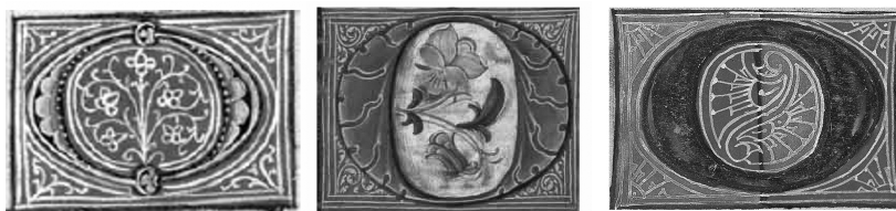
s. XV Misal de Toledo (BNE, VITR/4/, f. 66v)

dral parecen señalar diferentes iluminadores 17 . Las letras capitales del corpus, con menor tamaño que la inicial, constan de adornos vegetales lobulados que dibujan el perfil de su forma y aparecen encuadradas en un marco rectangular o cuadrado de fondo rojo y follaje estilizado en colores dorados (Figura 7.2) 18 . Estos adornos vegetales son característicos de los siglos XV y XVI, tanto en impresos como en manuscritos, con una tendencia progresiva a la esquematización de sus trazos 19 .