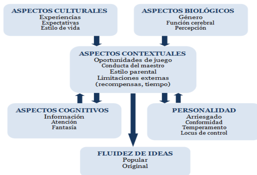
Figura 1: Aspectos importantes para mejorar la creatividad en el aula. (Tegano, Moran y Sawyers, en Navarro, 2008, p. 57)

Tegano, Moran y Sawyers presentaron (cit. por Navarro, 2008), los aspectos importantes que hay que tener en cuenta para intervenir en la mejora de la creatividad en un aula de Primaria. Tal y como se muestra en el siguiente esquema, son: