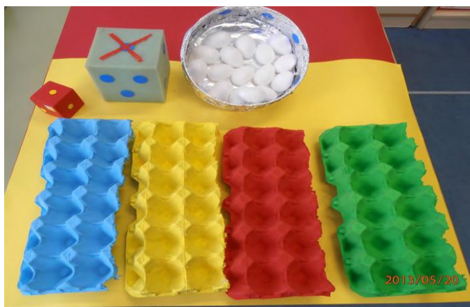
Foto ejemplo actividad con hueveras de cartón