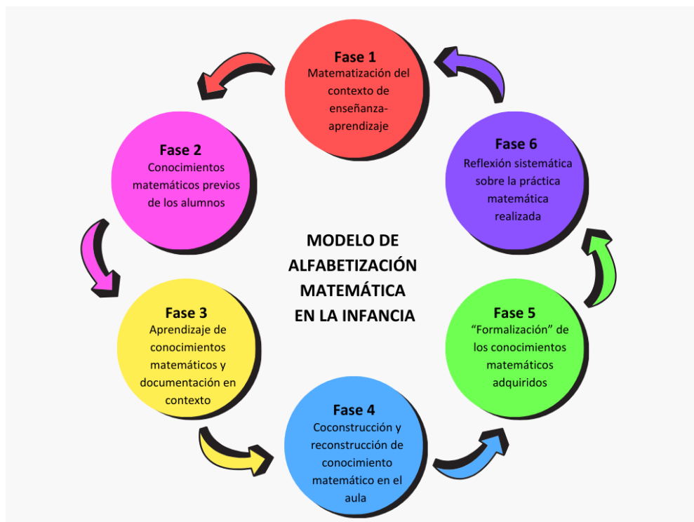
Figura 1. Modelo de Alfabetización Matemática en la Infancia de Alsina (2017)