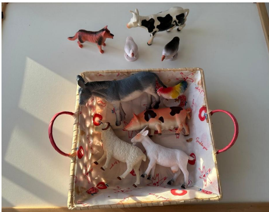
Foto cesto animales