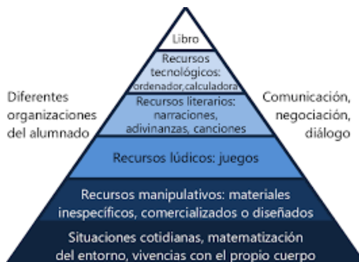
Figura 2. Pirámide de la educación matemática (Alsina, 2010)