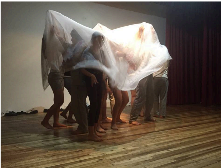
Estudiantes de 1ero BGU, Actividad: ¿Son metáforas o qué?.