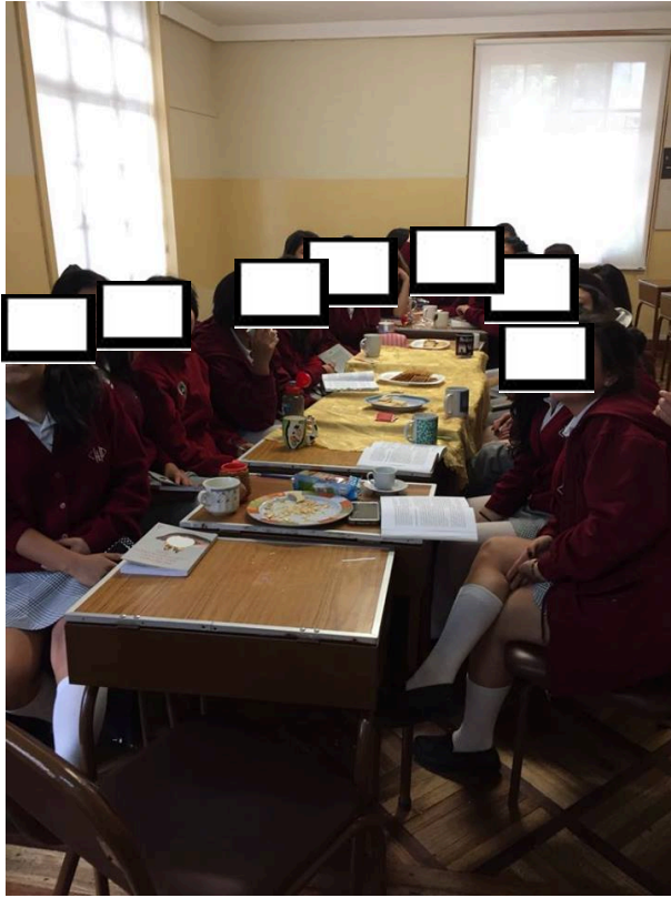
Estudiantes de 3ero BGU, Actividad: Tertulia literaria.