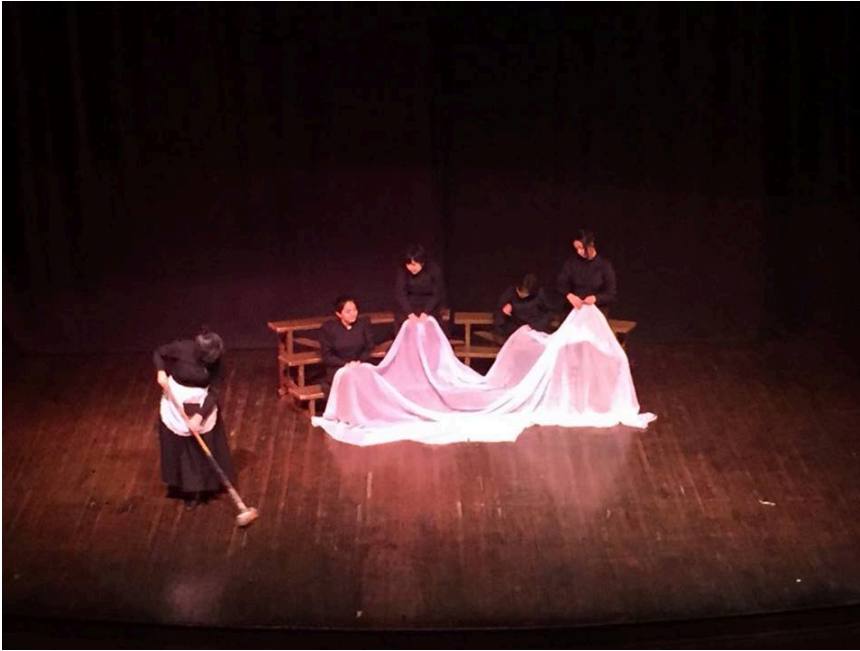
Estudiantes de 3er BGU, Actividad: Contexto y texto, dramatización de La casa de Bernarda Alba .