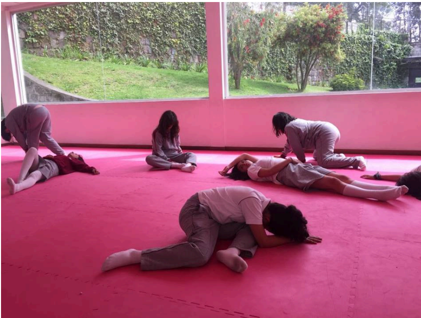
Estudiantes de 1ero BGU, Actividad: Te canto poesía.