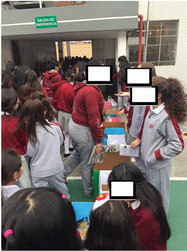
Estudiantes de 3ero BGU, Actividad: Entre lo nuevo y lo viejo.