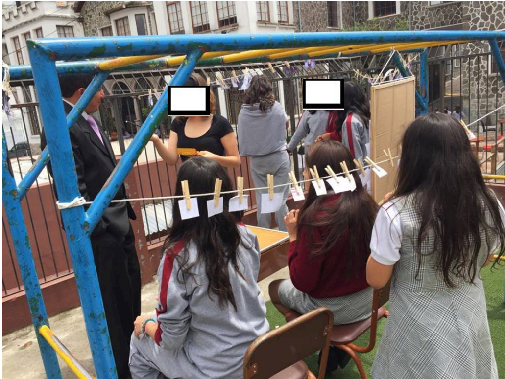
Estudiantes de 1ero BGU, Actividad: Divertimentos.