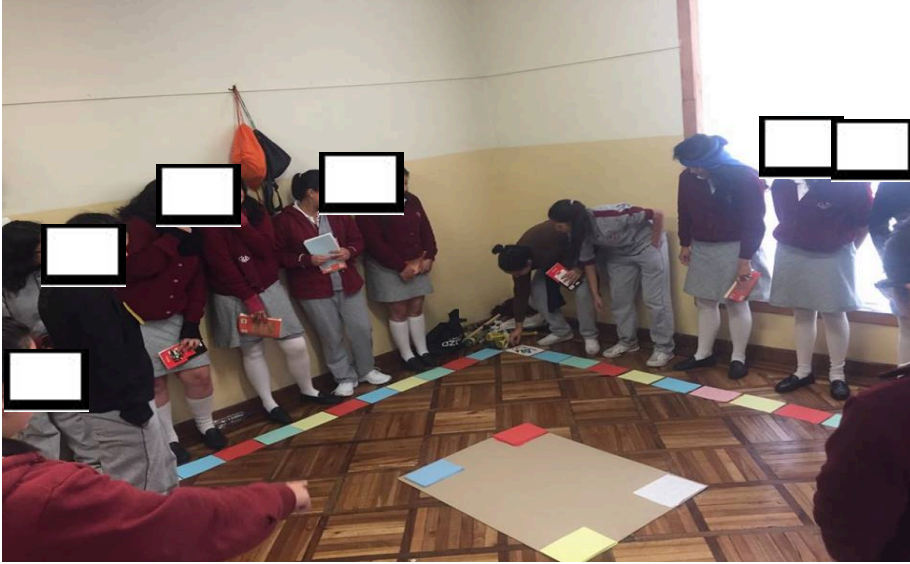
Estudiantes de 2do BGU, Actividad: Caras y gestos literarios