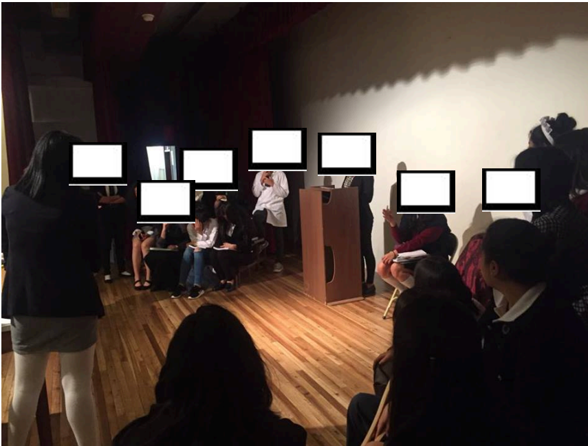
Estudiantes de 1ero BGU, Actividad: Personaje visita autor I