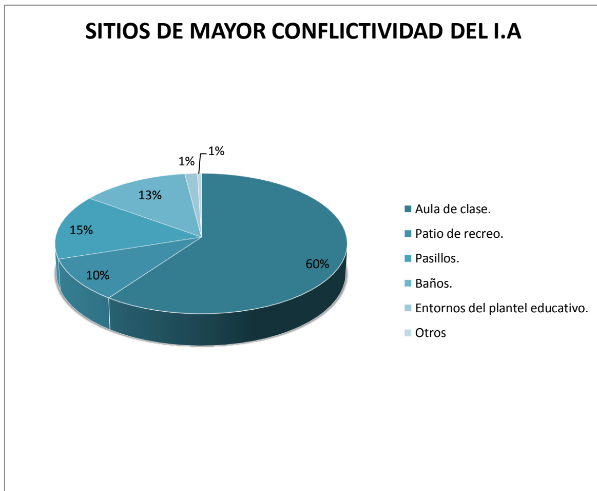
Gráfica N°1 Sitios de mayor conflictividad del Instituto Antioquia