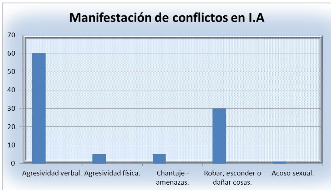
Gráfica N°2 Manifestación de conflictos en el Instituto Antioquia.

mayor fuerza en los grados octavo y décimo, donde las niñas constantemente se recuestan en los varones, los tocan, les dicen cosas provocativas, se echan encima de ellos, los acosan telefónicamente, les ponen comentarios en redes sociales etc. Los jóvenes del sexo masculino que han sufrido este tipo de acoso escolar, piden ayuda de manera indirecta a los profesores, otros se aprovechan de la situación, hecho que es constantemente supervisado por todos los docentes y directivos, para evitar situaciones de difícil manejo. Aunque por las edades de los jóvenes, se puede ver como normal cierto tipo de situaciones, no deja de ser preocupante de lugar que la mujer está ocupando en este tipo de conflictos a nivel escolar, pues se podría decir que dentro de los casos estudiados no se evidenció acoso de parte de los hombres hacia las mujeres, pero si se ve con claridad de manera inversa, allí es apremiante una campaña donde se propenda por la resignificación de los valores de la mujer como fuente de ternura, amor, delicadeza, vida, pero sobretodo de respeto y valía.