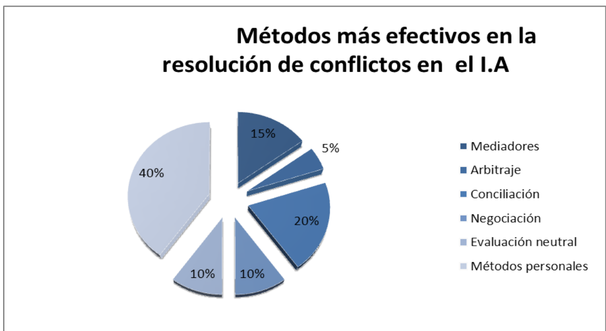
Gráfica N°4 Métodos más efectivos en la resolución de conflictos en el I.A