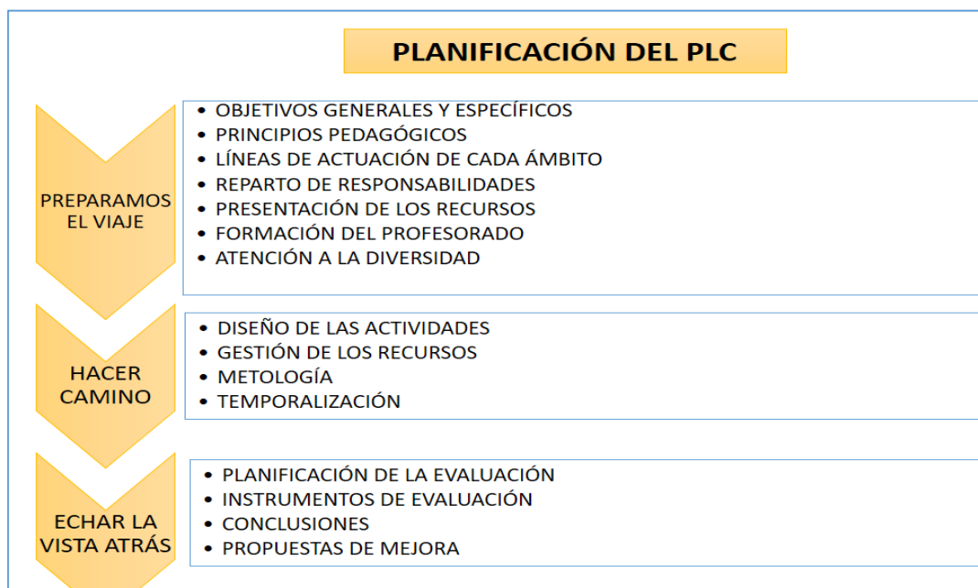
Tabla 2. “Planificación del PLC” (Elaboración propia)

En base a estos dos modelos y a otros de similares características se propone a continuación un esquema de la fase de planificación y desarrollo del PLC que integra diferentes perspectivas, combinando la funcionalidad del documento y la creación de un proyecto ágil, dinámico y actualizado a la vez que sólido y estable.