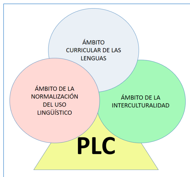
Figura 2: Ámbitos de trabajo del PLC (Elaboración propia)

De esta forma, buscarán la interconexión de los tres ámbitos fundamentales que serán objeto dentro del PLC.