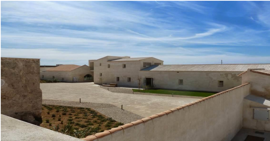
Figura 10: La Chanca en la actualidad.