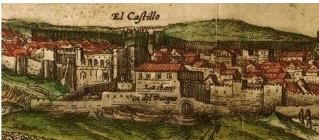
Figura 7: detalle del grabado de Hoefnagle donde se aprecia la Torre de Guzmán como parte del conjunto de la fortaleza