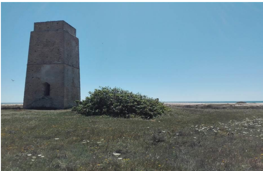
Figura 5: Torre de Castilnovo desde el prado, al fondo el océano Atlántico