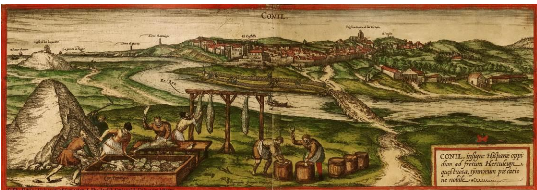
Figura 1: Conil desde el Prado de Castilnovo. Grabado de Hoefnagle.