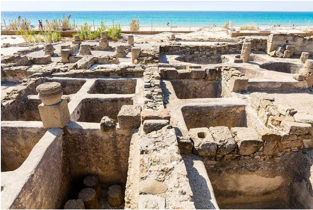
Figura 12: factorías de salazones de la antigua Baelo Claudia, Tarifa (Cádiz)