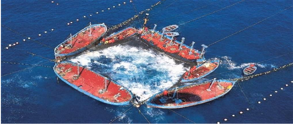
Figura 2: vista aérea de la “levantá” de la almadraba de Conil