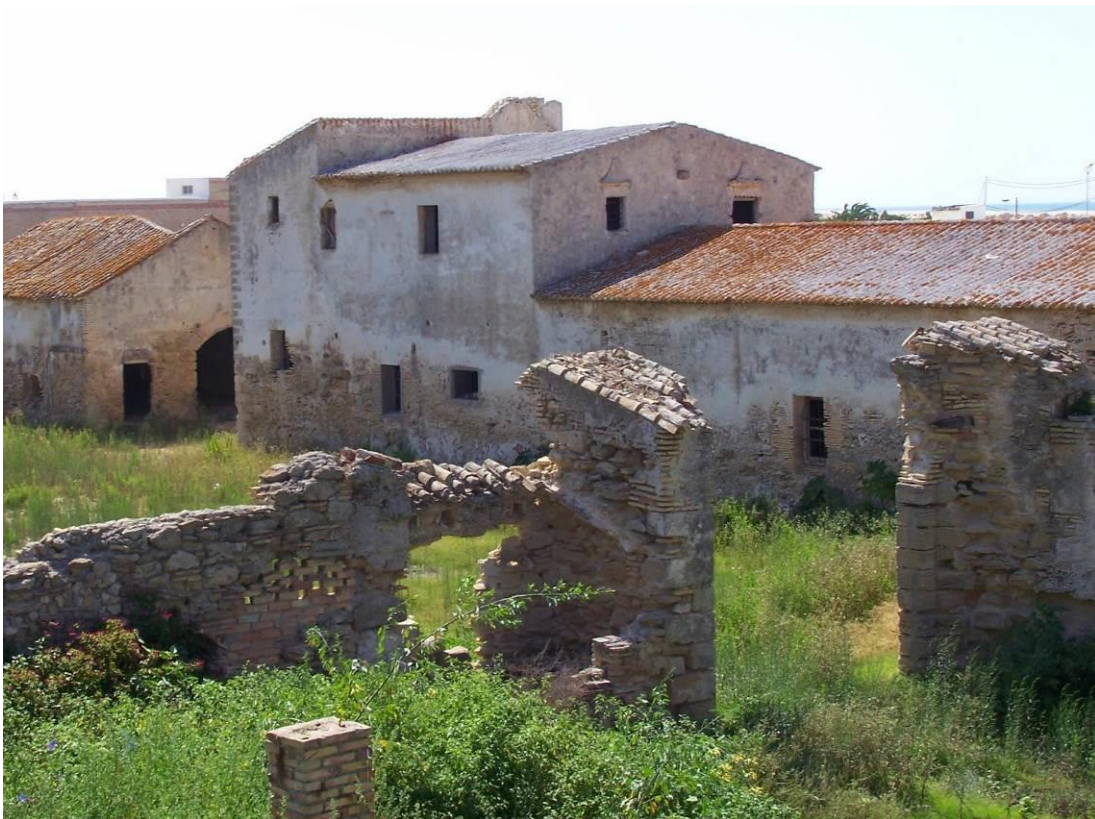
Figura 9: La Chanca en estado de abandono, previo a su rehabilitación