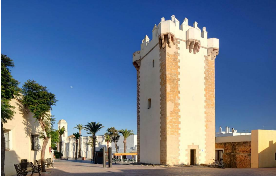
Figura 6: torre de Guzmán.