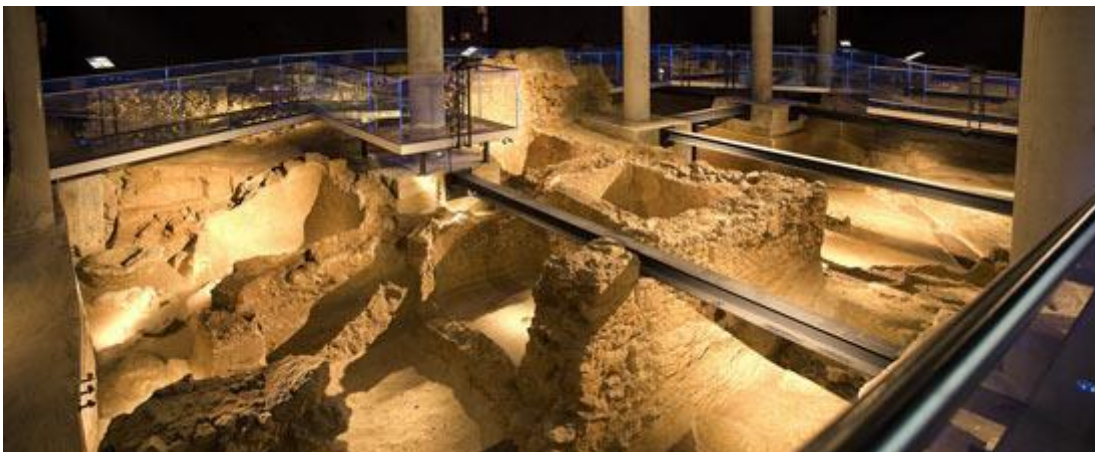
Figura 11: vista general del yacimiento arqueológico Gadir situado en Cádiz capital