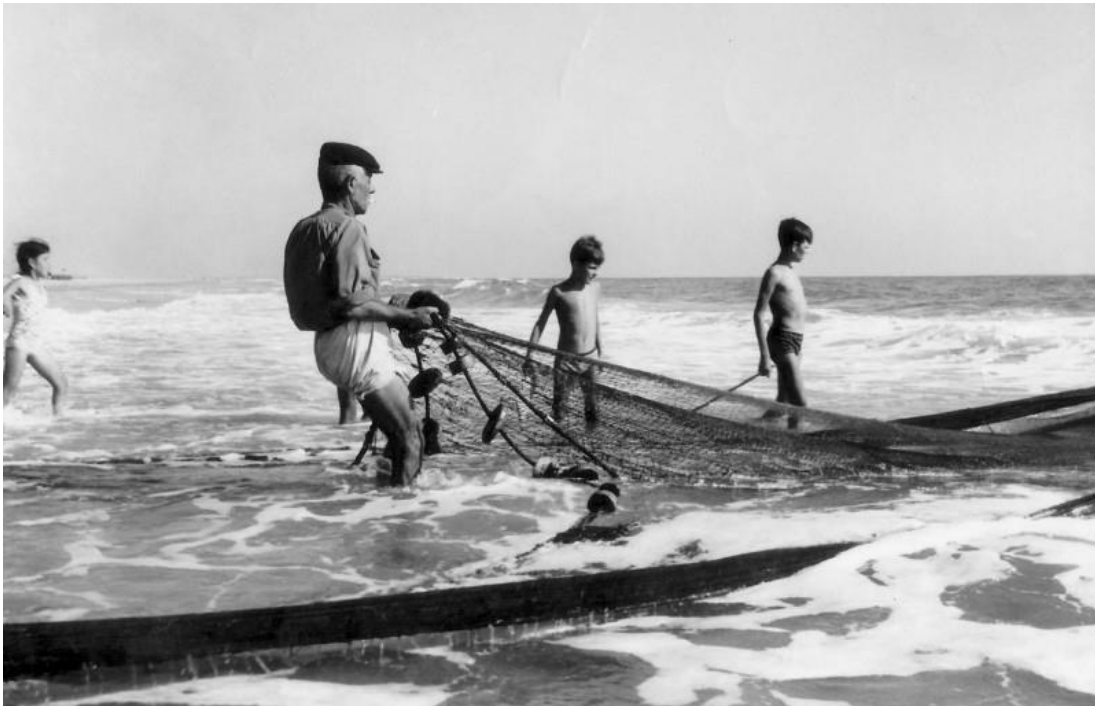
Figura 3: hacia finales de los años 60, los jabegeros arrastras las redes hacia la playa