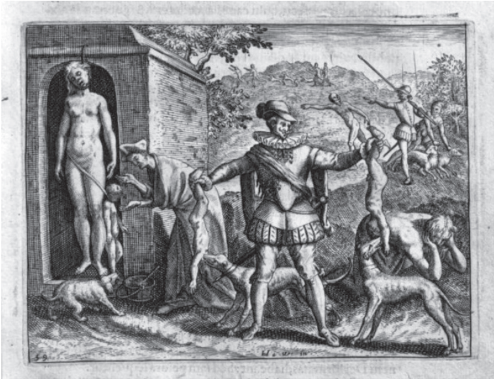
Grabado de Theodor de Bry (1528-1598) que ilustra el libro Narratio regionum indicarum per Hispanos quosdam devastatarum verissima , de Bartolomé de las Casas (1474-1566). La imagen es una captura de pantalla de esa obra digitalizada, que se puede consultar online en www.archive.org

moderna o la incapacidad radical para aceptar el progreso científico y la Ilustración. La Edad Media como época de oscuridad y tinieblas fue, en buena medida, un invento de la propaganda protestante para definir un milenio entero de retroceso entre la antigüedad grecorromana, clásica, y la recuperación postmedieval portadora de la luz y de la innovación correspondiente a la llegada de Lutero. No es cierto, en absoluto, que el catolicismo rompiera con la esperanza de modernidad del Renacimiento. Antes, al contrario, ese ciclo brillante de la historia floreció precisamente en aquellos lugares donde se dio el primer encuentro del mensaje de Cristo y la herencia humanista