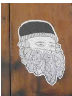
Figura 12:señor con barba, cartel en Barcelona