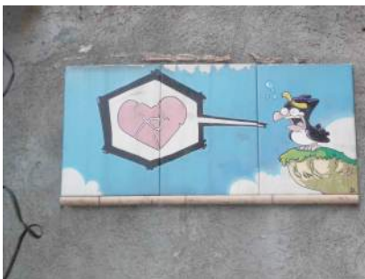
Figura 10: composición con azulejos en Barcelona