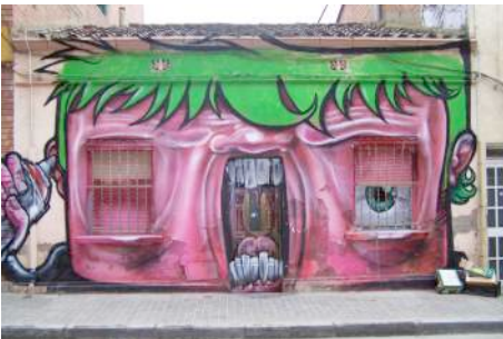
Figura 2: graffiti en la fachada de una casa de Lleida