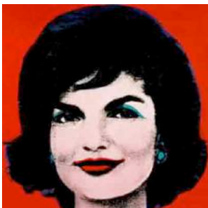
Figura 22: Jackie Kennedy, por Warhol

https://warholitos.wordpress.com/2013/09/30/5-formas-de-acercar-la-obra-de-andy-warhol-a-los-ninos/