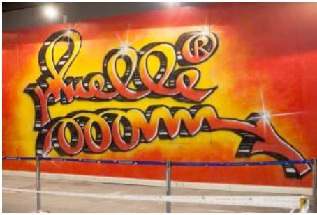
Figura 4: Tag de Muelle