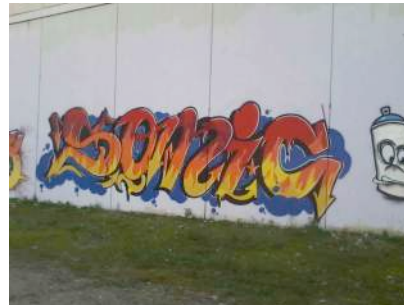
Figura 3: Firma en muro (Lleida)