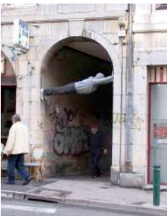
Figura 16: instalación de Marc Jacobs