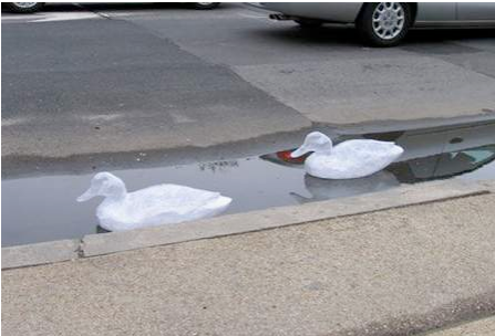
Figura 14: patos con cinta adhesiva