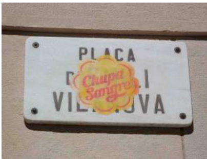
Figura 6: Chupa sangre/ pegatina en Barcelona