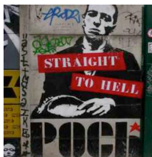
Figura 13: obra de Poch