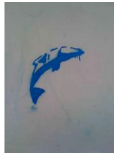
Figura 5: delfín con técnica de stencil