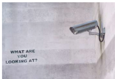
Figura 2: estencil de Banksy en Londres