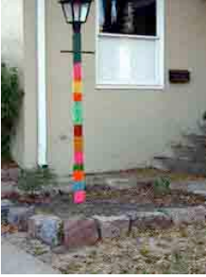
Figura 18: farola engalanada en lana