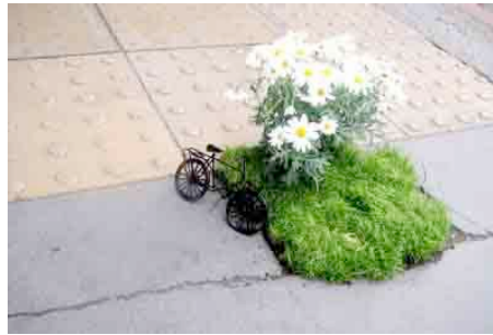
Figura 9: jardinería de guerrilla