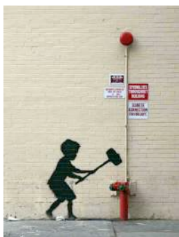
Figura 1: Bfuws

Se confeccionará un libro de autor sobre Banksy (1974). Será necesario pedir colaboración a las familias para la recopilación de la información. Se seleccionarán algunas obras de Banksy para debatir sobre ellas. Se aconseja escoger una frase, por un lado, y una imagen por otro. A modo de ejemplo se han seleccionado las siguientes imágenes, “Bfuws”, como representación de una ilustración hecha con la técnica del estencil, y “What are you looking at?”, como representación de frase: