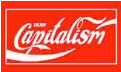
Figura 8: Capitalismo.- Adbusting