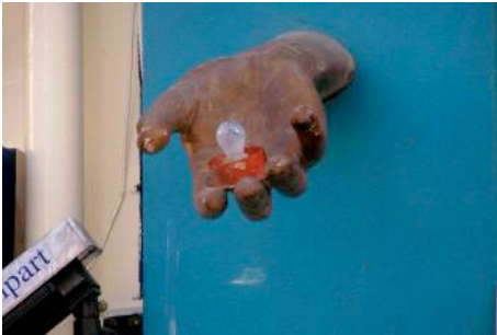
Figura 19: mano con chupete en Londres