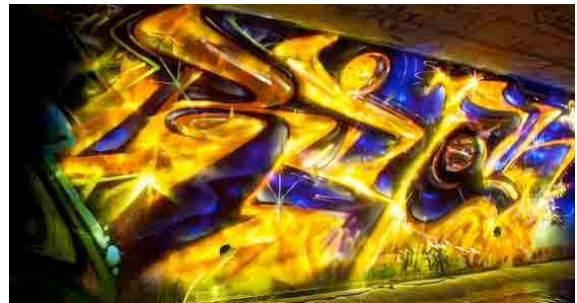
Figura 17: graffiti luminoso, un ejemplo