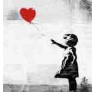
Figura 23: Niña con globo de corazón, de Banksy