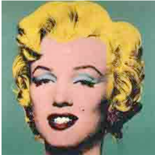
Figura 21: Marylin, obra de Warhol.