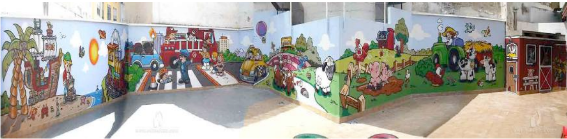
Figura 1: Graffiti en la pared de un colegio infantil