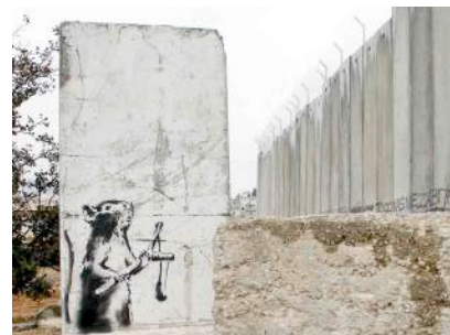
Figura 24: pal_rat2, obra de Banksy

http://www.stencilrevolution.com/banksy-art-prints/