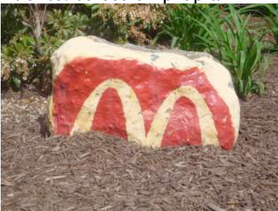
Figura 20: piedra pintada con el logotipo de McDonalds en EUA