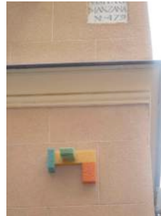
Figura 15: composición con esponjas en Madrid