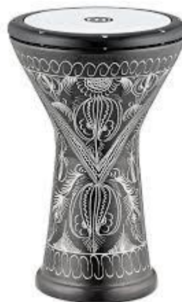
Ejemplo Ficha 2