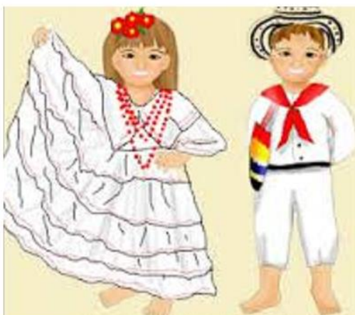
Ejemplo Ficha 3