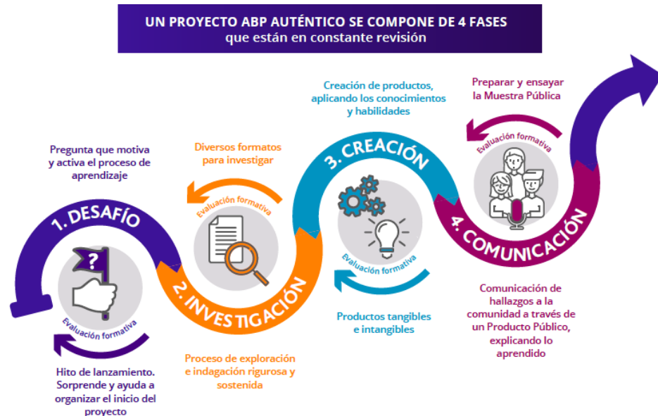
Figura 2. Ruta de Aprendizaje ABP.