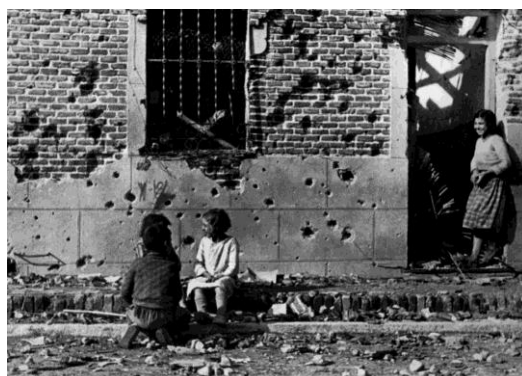
Imagen 2. Capa R. (1936). Niños delante de una casa en Entrevías