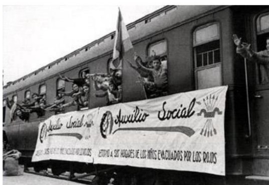
Fotografía 18 Llegada a Madrid de niños repatriados desde Francia, h.1939. Ministerio de cultura, Archivo General de la Administración, Alcalá de Henares.

Trabajo en grupos de 2 alumnos a partir de fotos proyectada con un retroproyector.