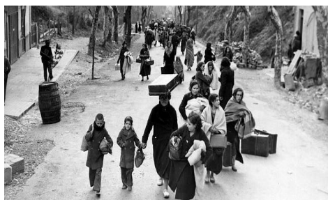
Imagen 3. Un grupo de madres e hijas en bando republicano camino del exilio en 1938.