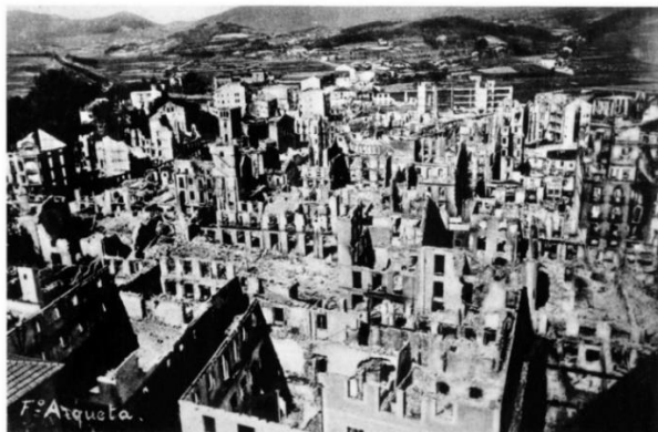
Figura 2. Vista aérea de Guernica.