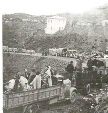
Imagen 4. El exilio republicano. (S.F.)