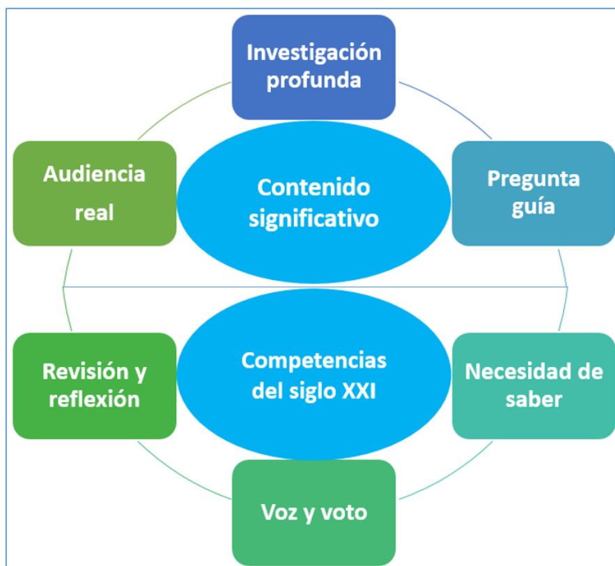
Figura 3. Elementos esenciales en un proyecto ABP de calidad.