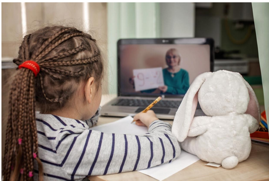
Figura 6. Imagen educación a distancia (01 de diciembre 2020)

En diversos países para paliar la desigualdad educativa producida por la brecha digital se han regalado aparatos tecnológicos como iPad o tablets, para que los/as menores que no tuviesen acceso a los mismos no se vieran relegados a un segundo plano por la propia sociedad. (Lloyd, 2020).