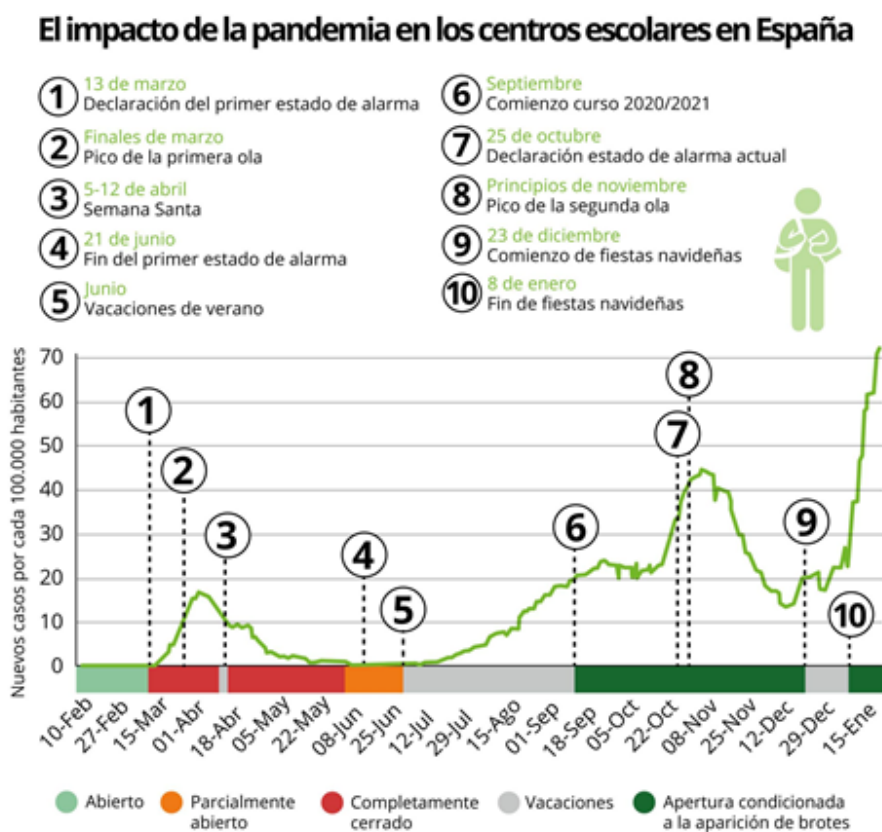
Figura 5. Impacto de la pandemia en los centros escolares en España