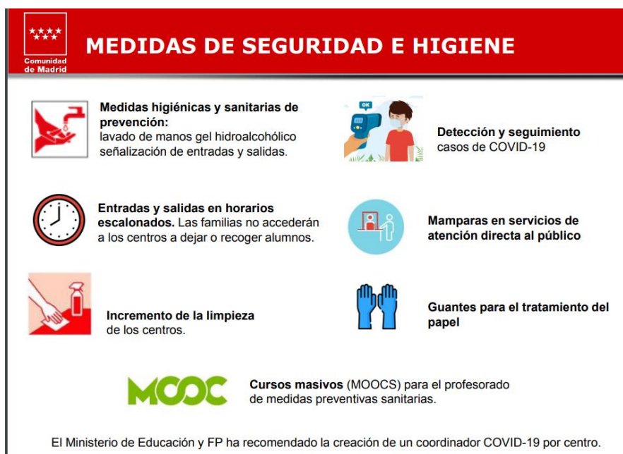
Figura 7. Medidas de Seguridad e higiene en escuelas de la Comunidad de Madrid

Todas estas medidas aún no constan formalizadas y se están revisando con cautela, pues no hay que olvidar que aún permanece el periodo de pandemia. (Consejería de Educación, Universidades, Ciencia y Portavocía, 2021).