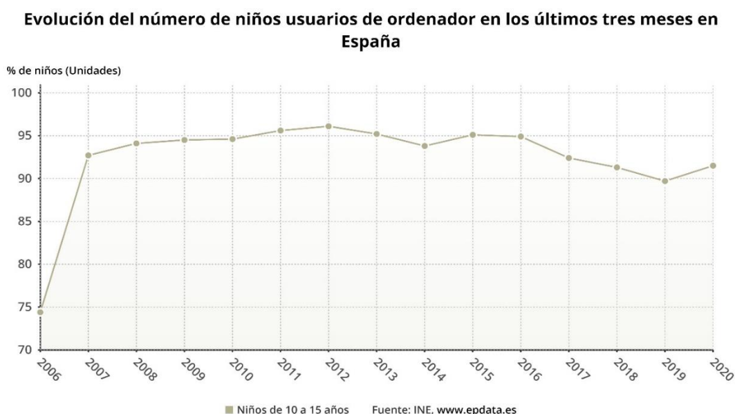
Figura 3. Evolución del número de usuarios menores de 10 a 15 años en relación con el uso de ordenadores en España tras la pandemia

intervienen varios participantes existe dificultad comunicativa, pues las plataformas habilitadas por los organismos correspondientes no están tecnológicamente adaptadas a la agilidad que requiere el momento actual. De hecho, un estudio realizado por el Instituto Nacional de Estadística (INE) en el primer trimestre del año 2021, constata como ha incrementado el uso de ordenadores en menores de edades comprendidas entre 10 y 15 años, desde el año 2019 en adelante tras la pandemia sufrida. (INE, 2021).