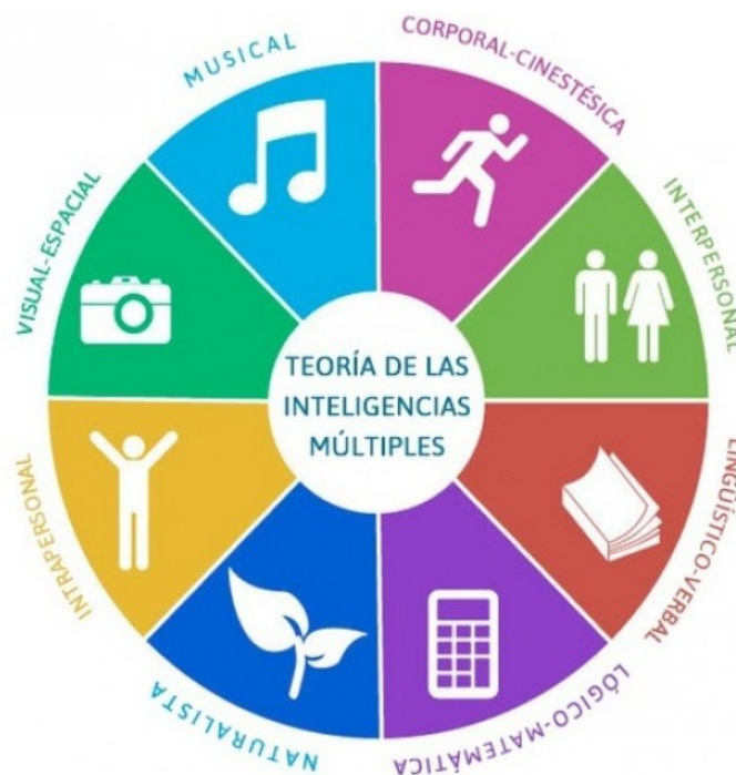
Figura 2. Inteligencias Múltiples de Howard Gardner.

Tradicionalmente se hablaba de habilidades en el ámbito de lógico matemático y lingüístico, es decir que el ser humano tenía dos inteligencias, la inteligencia lógico matemática y la inteligencia lingüística. Además se consideraba que la inteligencia del ser humano era algo innato, se nacía inteligente y no era resultado de determinados procesos de enseñanza y aprendizaje producidos en el aula. Gardner (1987) por el contrario, define la inteligencia como la “capacidad de resolver problemas o elaborar productos que sean valiosos en una o más culturas”. Es por ello que a través de un estudio sobre el pensamiento humano, Gardner desarrolla la Teoría de las Inteligencias Múltiples en la que entiende que no existe una única inteligencia e inseparable, sino que distingue 7 inteligencias múltiples, a las que después añade una 8, que cada alumno podrá desarrollar de diferente manera y en mayor o menor medida en función de cómo reciben y asimilan los mejores conocimientos que el profesor le transmite y enseña. Las 8 inteligencias de las que habla Howard Gardner son las que se representan en la Figura 2: