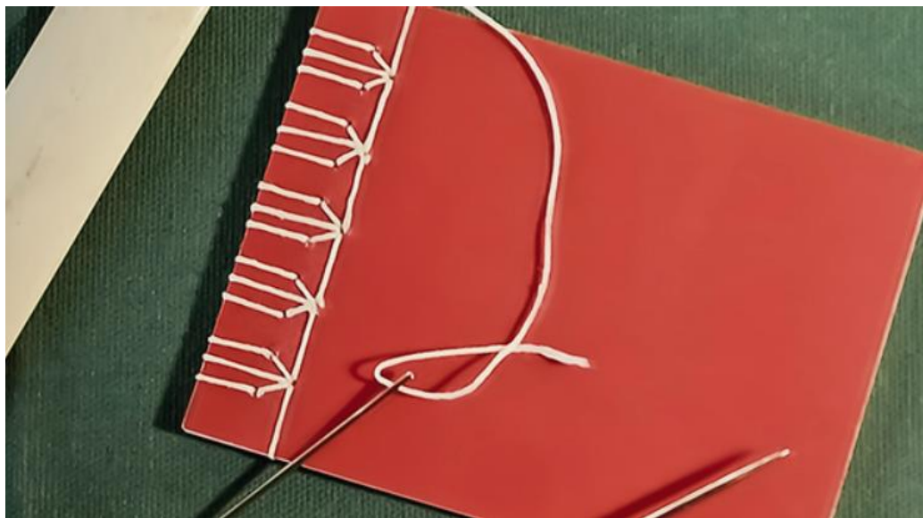
Figura 10. Ejemplos de encuadernación manual: japonesa y artesanal