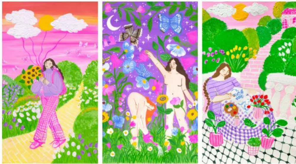
Figura 5. Ilustraciones de Blasina Rocher (exposición Amanecer)