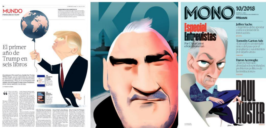
Figura 6. Ilustraciones de Luis Grañena (prensa)