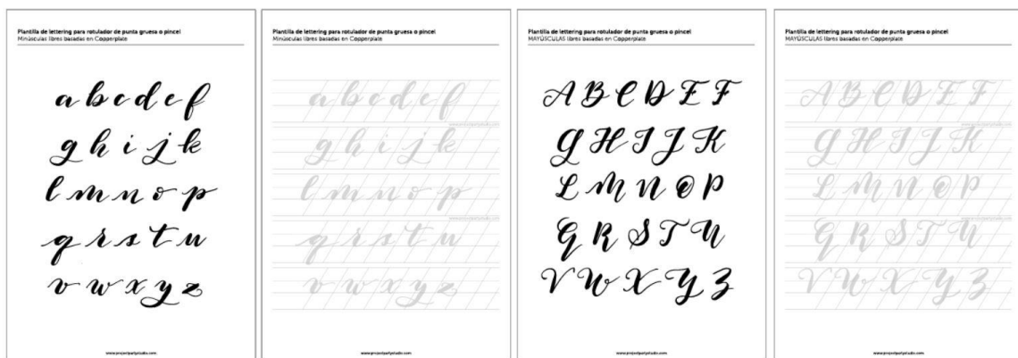
Figura 7. Plantilla ejemplo para aprender lettering

https://drive.google.com/file/d/1iOjq0HRKgW070GVJzLRsT3y-6hd9ps4X/view