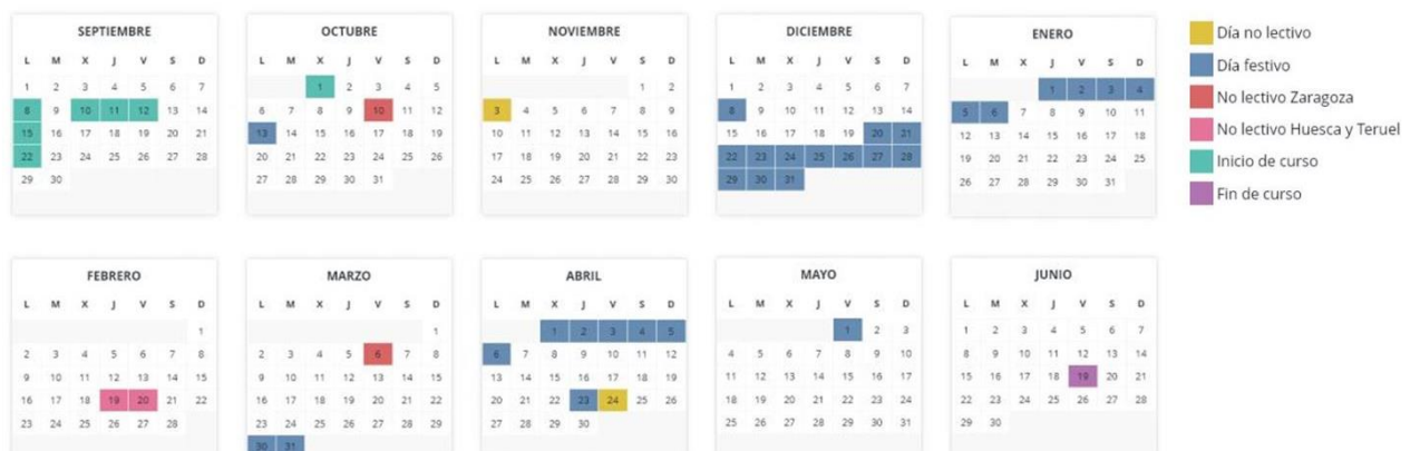
Figura 2. Muestra del calendario académico 2025-2026 en Aragón.

Fuente: Zaragoza Joven (Ayuntamiento de Zaragoza, 2025).