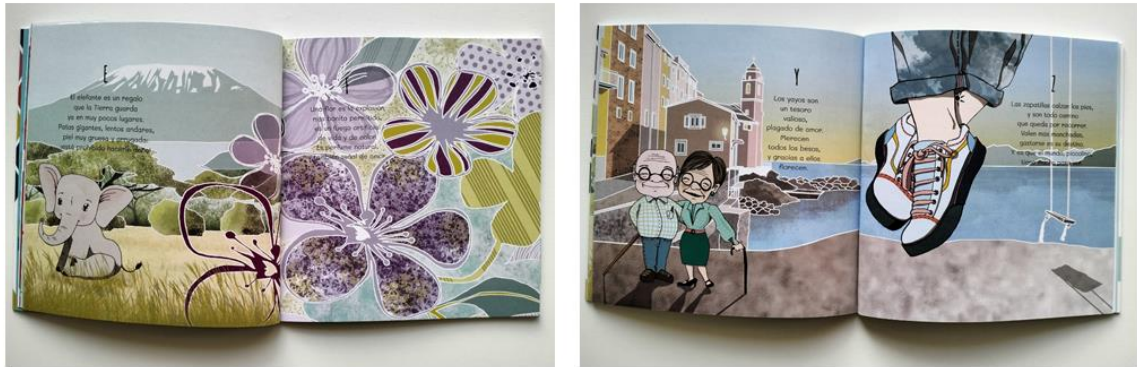
Figura 8. Mi abecedario ilustrado. Interior de los pliegos E-F e Y-Z