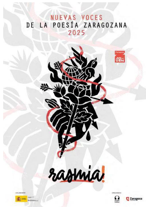
Figura 1. Portada del recopilatorio de poesías seleccionadas en la 7ª edición del festival de poesía zaragozana Rasmia 2025.