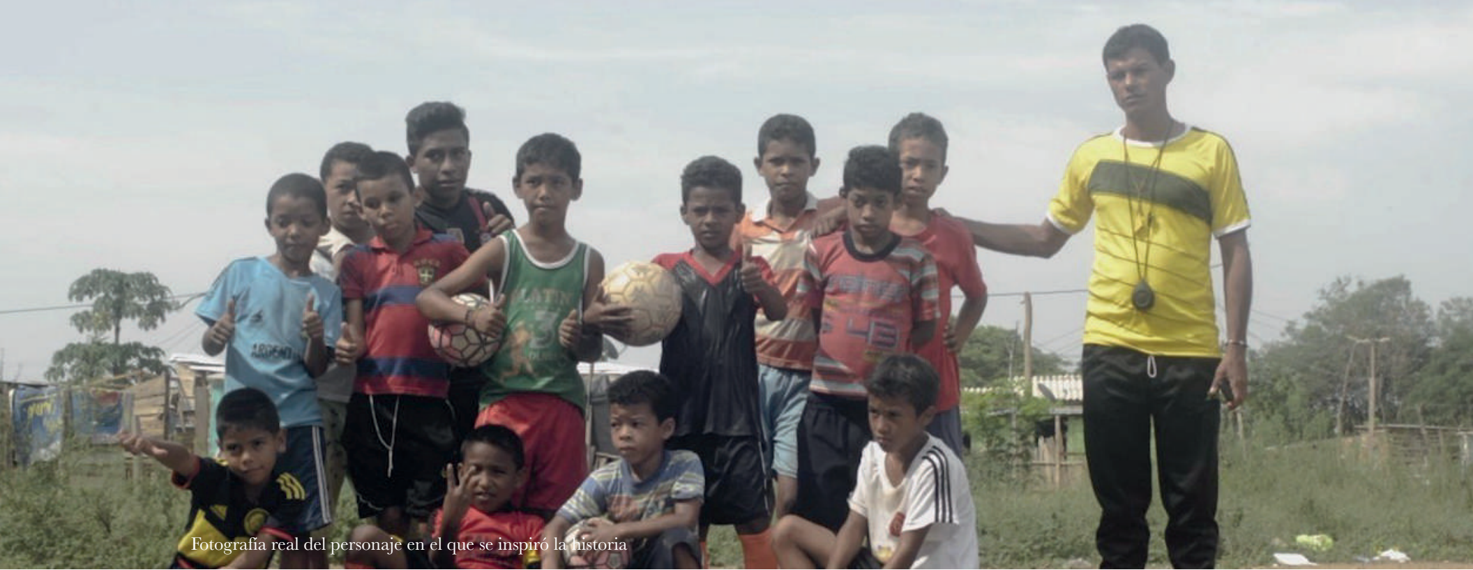
Fotografía real del personaje en el que se inspiró la historia