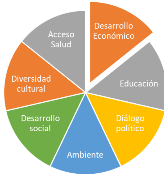
Figura 3. Aspectos que enmarcan los objetivos constitutivos de la UNASUR

La tendencia a largo plazo hacia la integración regional es clara: en las últimas dos décadas ha habido un progreso constante hacia economías regionales más integradas en casi todas las partes del mundo (Consani, 2016). En Asia oriental, se están realizando esfuerzos para concluir negociaciones sobre la Asociación Económica Integral Regional de 16 países, que abarcaría varias economías importantes y mejoraría el comercio de bienes y servicios, la inversión, la cooperación económica y técnica, la propiedad intelectual, la competencia y la solución de controversias, entre otros. Cuestiones (Bonilla, 2014).