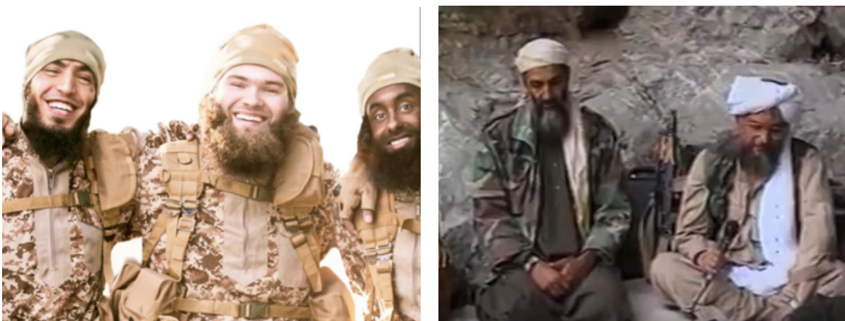
Foto de la izquierda: Fotograma de un vídeo del Daesh difundido por la productora Al Hayat Media Center el 25 de noviembre de 2015 y titulado «No respite». Fuente: (Lesaca, 2017). Foto de la derecha: Fotograma de un vídeo difundido por Al Jazeera en octubre de 2001. Fuente: Al Jazeera . Disponible en: https://www.youtube.com/watch?v=_bHX3N7kxO4&t=2s