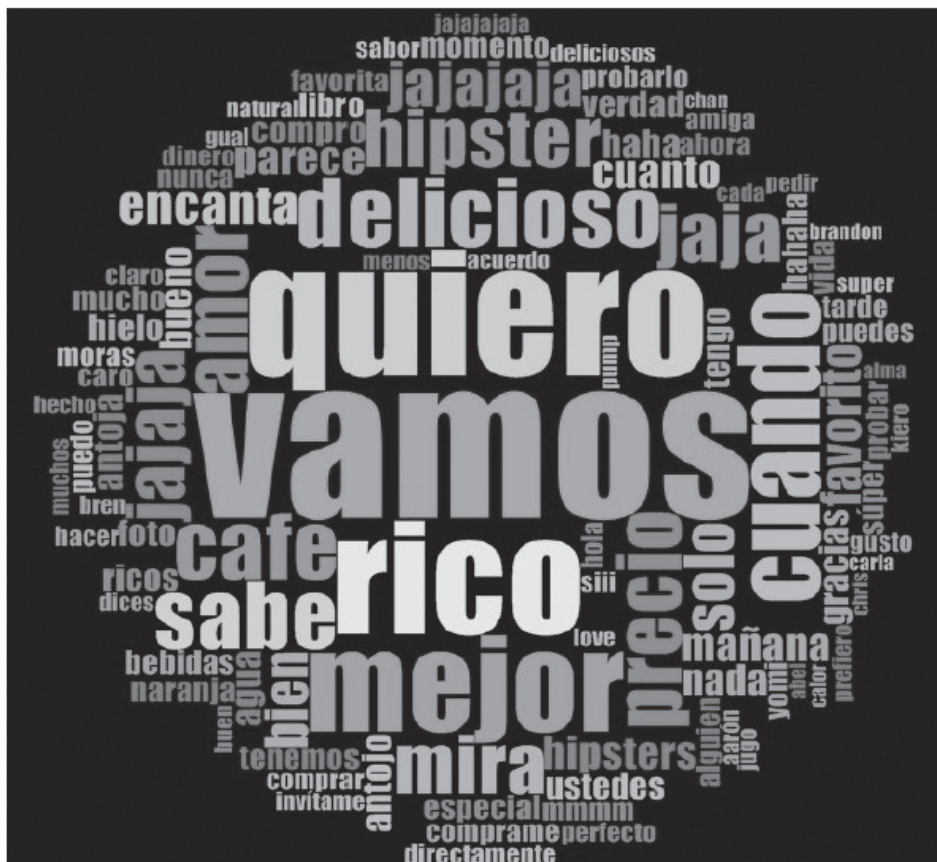
Figura 1. Nube de «tags» de palabras frecuentes

Para distinguir y medir las emociones expresadas por los miembros de la comunidad de la marca, las dividimos en positivas y negativas según las categorías que sobresalieron en la revisión de literatura. Las palabras positivas más comunes encontradas en los comentarios, según nuestra tipología y los resultados de NVivo fueron: vamos, quiero, rico, delicioso, momento, amor, mejor, antojo.