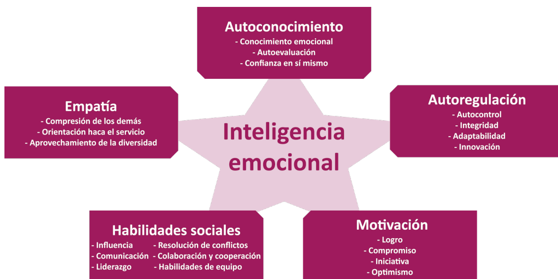
Figura 2: Adaptación de Gómez (2016) sobre las competencias principales de Goleman (1996).

Unos años más tarde Goleman (1996) logra una mayor difusión de este concepto apartándolo de la ciencia pura y haciéndolo más cercano y común a toda la población y a todos los ámbitos, desde la escuela infantil hasta el mundo laboral. Sitúa la cognición y la emoción en el mismo área cerebral y afirma que se necesita una mente más calmada para llegar a la concentración, a su vez necesaria para cualquier actividad. Enfoca la inteligencia emocional, reformulando las inteligencias múltiples de Gardner (1983) y define cinco competencias principales de la inteligencia emocional (véase Figura 2)