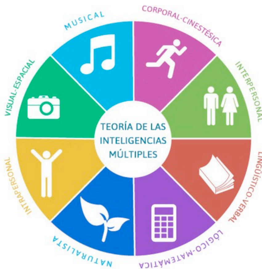
Figura 1 Tipos de inteligencia según Gardner.

En la Figura 1, Mercadé (2012) refleja los tipos de inteligencia según Gardner (1983).