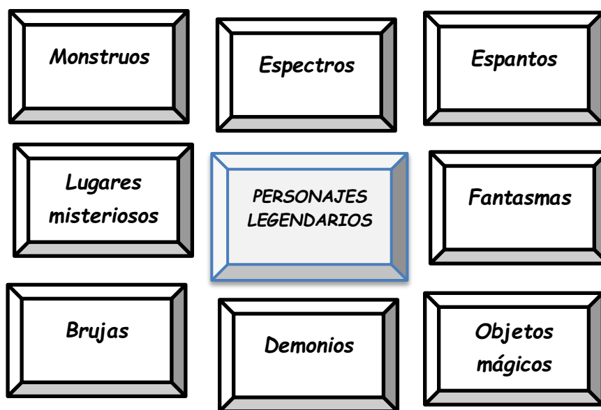
Figura 2. Personajes legendarios.

A continuación se visualiza un esquema proyectando la posible clasificación de personajes y algunos elementos de los relatos narrados: