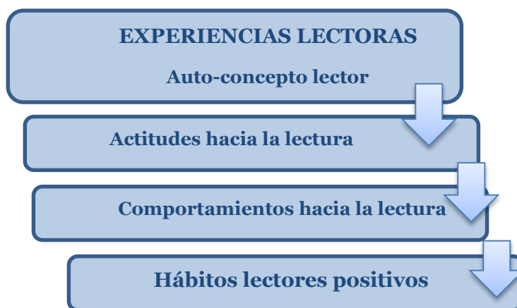
Esquema 1: Experiencias lectoras

Actitudes positivas hacia la lectura beneficiarán conductas adecuadas a la lectura; la reiteración de estas conductas apoyará de manera positiva a determinar el hábito lector. Asimismo, actitudes negativas originarán comportamientos de alejamiento de la lectura y, por tanto, hábitos lectores negativos, entendiendo por hábito lector la asiduidad con que se lee.