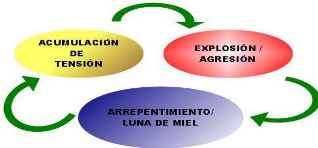
Figura 2. Ciclo de violencia en la pareja.