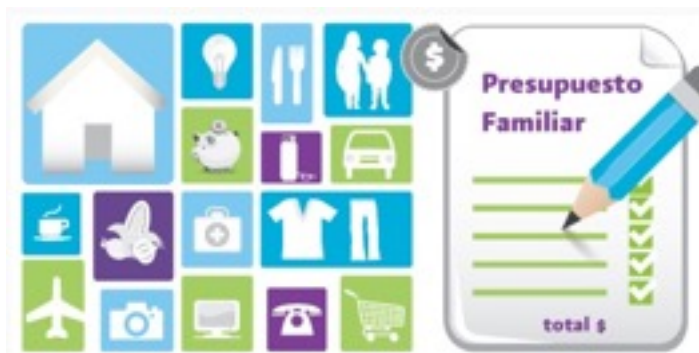
Figura 3. 12 formas de aumentar el presupuesto familiar, extraído de https://www.tributos.net/12-formas-de-aumentar-el-presupuesto-familiar-373/