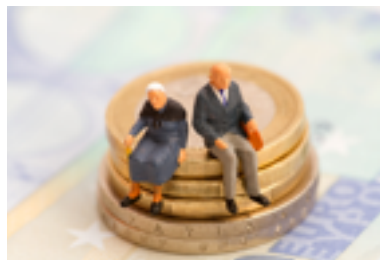
Figura 6. Imagen planes de pensiones, fuente http://www.bolsamania.com/declaracion-impuestos-renta/fiscalidad-de-los-planes-de-pensiones/