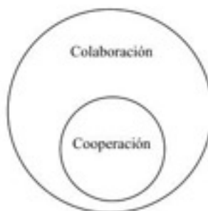
Figura 1. Cooperación como tipo de colaboración, extraída de Suárez, C. (2010), p. 58

Por ello, ambos conceptos no pueden confundirse como ocurre habitualmente, ya que la cooperación es una forma o tipo de colaboración, tal y como puede observarse en el siguiente gráfico, y la colaboración es al fin y al cabo un concepto amplio en el cual podremos englobar la cooperación.