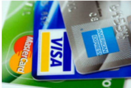
Figura 5. Imagen tarjetas de crédito