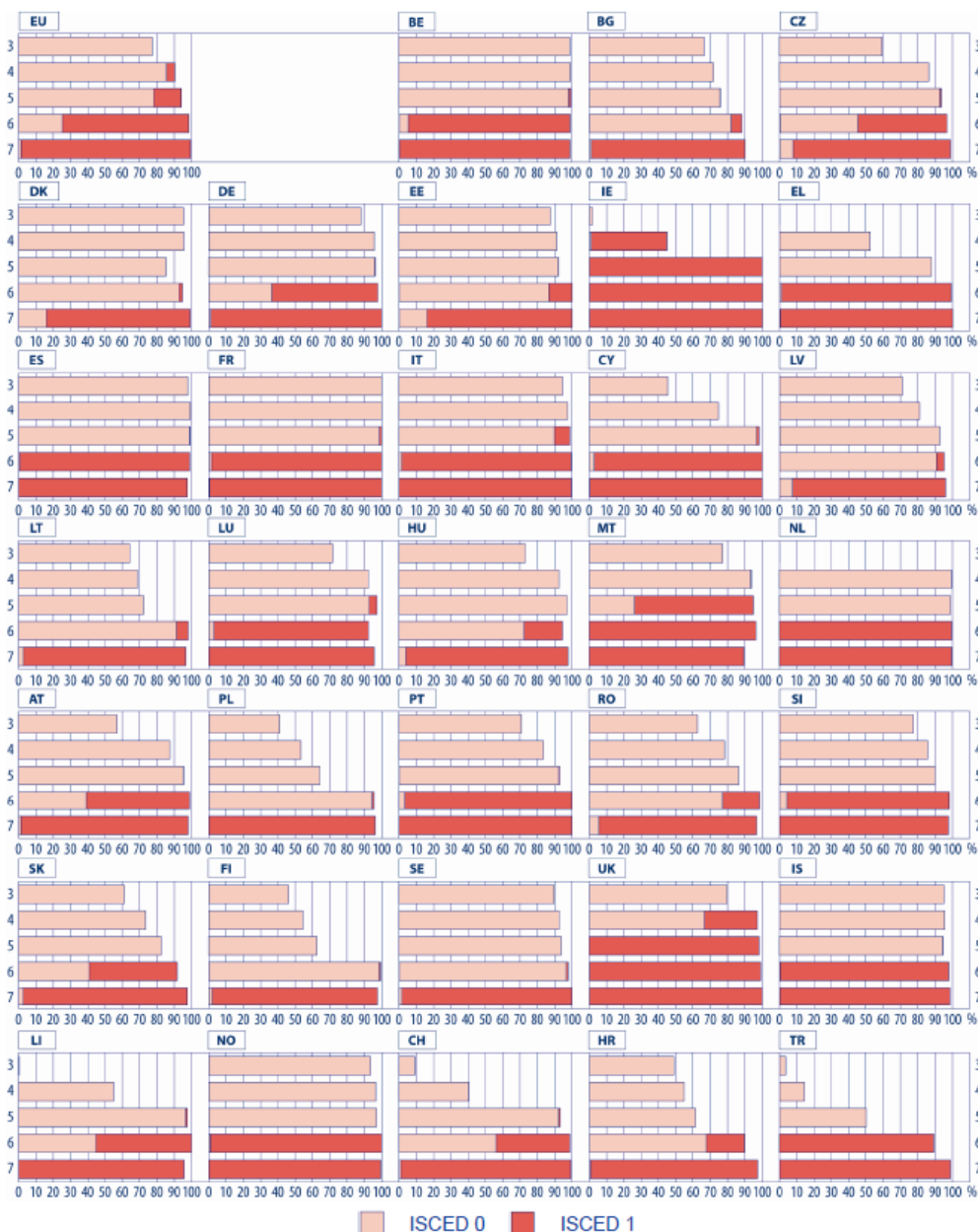
Figura 1: Índice de escolarización por edades en preescolar y primaria .

En el siguiente gráfico extraído de Eurostat (2012) pueden observarse las estadísticas europeas en cuanto a edades de escolarización.