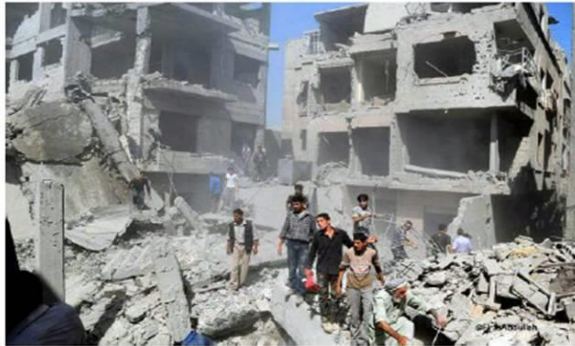
Unos ciudadanos de Duma revisan unos escombros tras un ataque del Gobierno el 22 de agosto.

Cuatro millones de sirios han huido de la guerra y malviven en los países vecinos. Otros ocho han sido desplazados de sus hogares por los combates. Muchos refugiados en Líbano o Turquía emprenden una segunda huida. En esta ocasión se juegan todos sus ahorros a una sola carta: llegar a Europa. Los sirios ya no temen morir y arriesgan su vida subiendo a frágiles barcas que a menudo naufragan en el Mediterráneo.