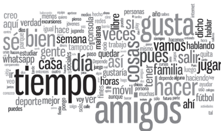
GRÁFICO 2: Nube de palabras de los jóvenes en situación de vulnerabilidad.

Presentamos a continuación el Cuadro 2, que resume las principales palabras