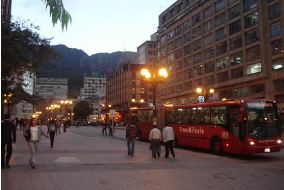
Centro de Bogotá.