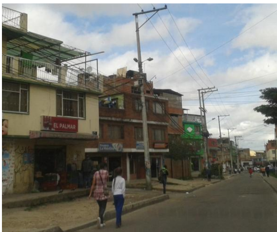
Barrio Molinos, en la periferia de Bogotá.

La Comisión Fílmica de Bogotá, es un programa de la Cinemateca Distrital de Bogotá con los objetivos de fortalecer las industrias audiovisuales de Bogotá y Colombia (televisión, publicidad, cine), promocionar la ciudad como destino fílmico para producciones nacionales e internacionales, y asesorar y facilitar la realización de rodajes con la implementación del Permiso Unificado para las Filmaciones Audiovisuales (PUFA).