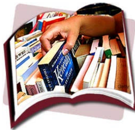
Imagen 3. Escoger libremente.

El niño lector debe ser libre a la hora de elegir sus libros aunque, en cierto modo, si se conoce, aunque sólo sea a grandes rasgos la personalidad del niño, se le puede sugerir la lectura de unos libros determinados. Teniendo siempre presente el no obligar jamás a leer lo que no desee. Saber qué tipo de obras suelen preferir los niños según maduración intelectual y psicológica es importante ya que esos intereses pueden ser una valiosa pista para llegar al objetivo. A la hora de motivar al menor hacia la lectura, es fundamental tener en cuenta la edad del niño y sus intereses, ya que los modelos de lectura van cambiando según la edad y los gustos de cada uno (Andricaín, 1999).