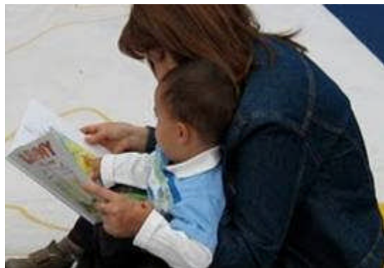
Imagen 1. Lectura regazo