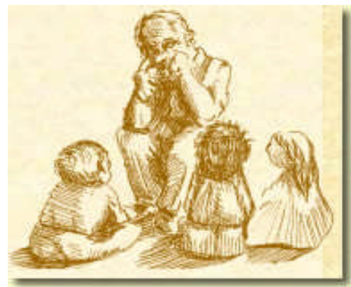
Imagen 4. Atentos al relato.