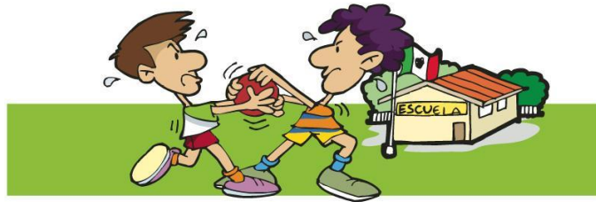
Figura 2. Lucha por un objeto