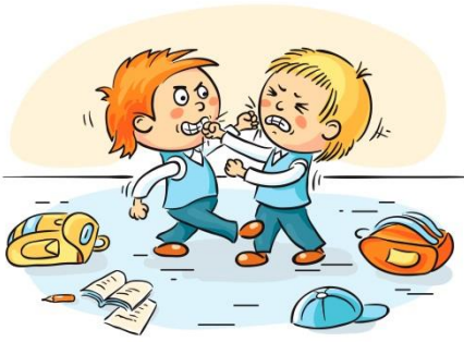
Figura 1. Agresión