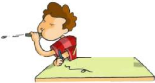
Figura 3. Mal comportamiento