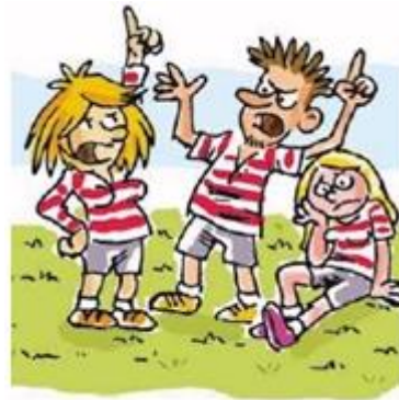
Figura 4. Manipulación