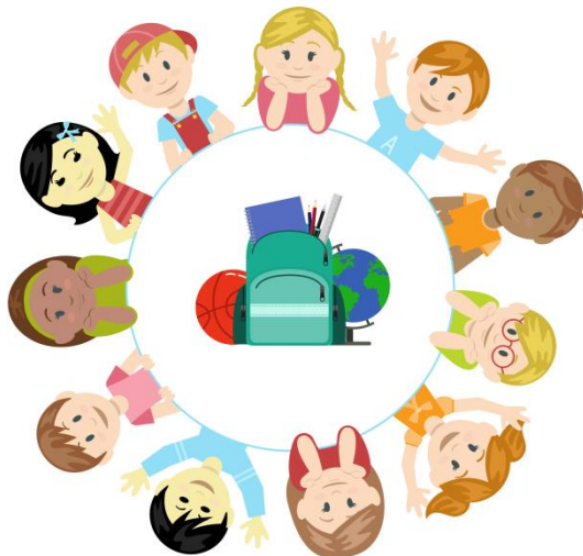
Figura 5. Asamblea (mediación)