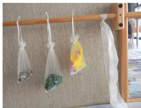
Para la barra del aula

https://lanenachimbarona.wordpress.com/page/5/