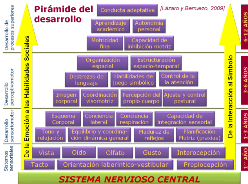
Ilustración 1. Pirámide del desarrollo