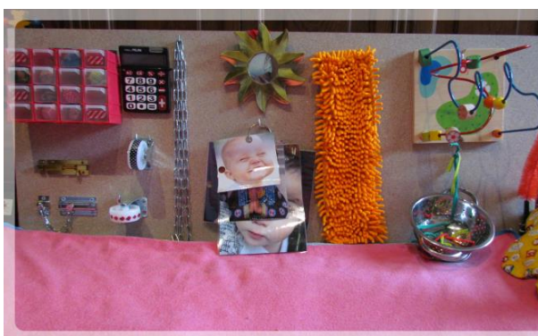
Para la pared del aula