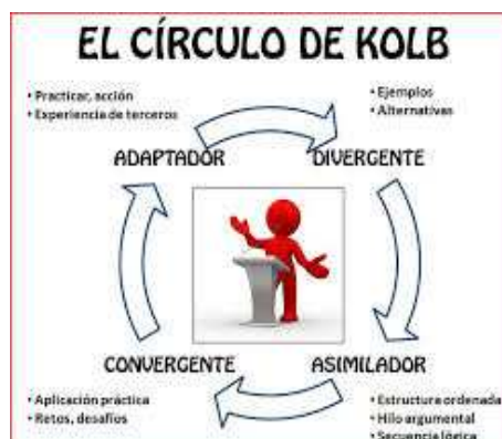
Figura 3. Estilos de aprendizaje del modelo de Kolb

Estos estilos de aprendizaje se pueden observar en la siguiente imagen (Figura 3), y funcionan cíclicamente en el sujeto.