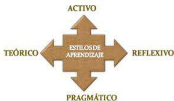
Figura 4. Estilos de aprendizaje por Alonso, Gallego y Honey