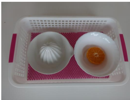
Foto 2. Material Montessori para extraer zumo.

El tema de los materiales es complejo ya que depende de una solvencia económica importante poder dotar a las aulas de materiales específicos de trabajo de estas dos metodologías. La propuesta que se hace es combinar los materiales propios de ambas pedagogías, para una misma aula. Por tanto, se podrán encontrar juguetes inacabados, a base de telas, troncos, lanas, madera etc propios de la escuelas Waldorf (podrían ser elementos reutilizados, que vayan recopilando las propias familias) y por otro lado, los materiales más estructurados del trabajo Montessori. Se trata de sets de trabajo que implican el desarrollo de una habilidad, desde exprimir zumo hasta cortar papelitos, contar, puzles etc. Aquí algunos ejemplos: