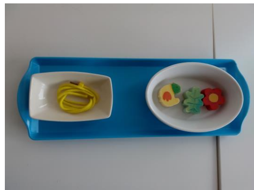
Foto 3. Material Montessori para ensartar.