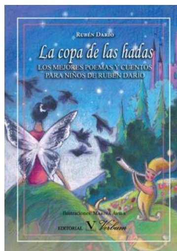
Figura 4. La copa de las hadas. Los mejores poemas y cuentos para niños de Rubén Darío.

Rubén Darío es un escritor conocido mundialmente que dedicó parte de su carrera a la literatura infantil. Esta recopilación de poemas tiene como telón de fondo un mundo donde seres fantásticos y hadas confluyen y ayudan a los niños a desarrollar su universo imaginario. En este caso, igual que el anterior, se hace patente la necesidad de descubrir la función lírica y estética del lenguaje.