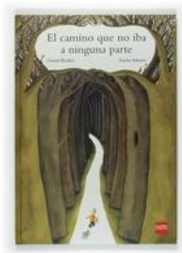
Figura 5. El camino que no iba a ninguna parte de Gianni Rodari Recuperado de http://www.literaturasm.com/El camino que no iba a ninguna parte.html

Este cuento habla de la autonomía de los niños, de ser valiente, de atreverse a explorar, a probar, de aventurarse.