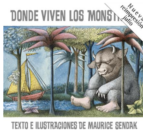
Figura 6. Donde viven los monstruos de Maurice Sendak

En el aula tiene muchas aplicaciones: Además de fomentar la imaginación de los niños, se puede trabajar para la superación del miedo, de la soledad (al protagonista lo castigan en su habitación y es allí donde ésta se convierte en un país imaginario) o el abandono, etc.