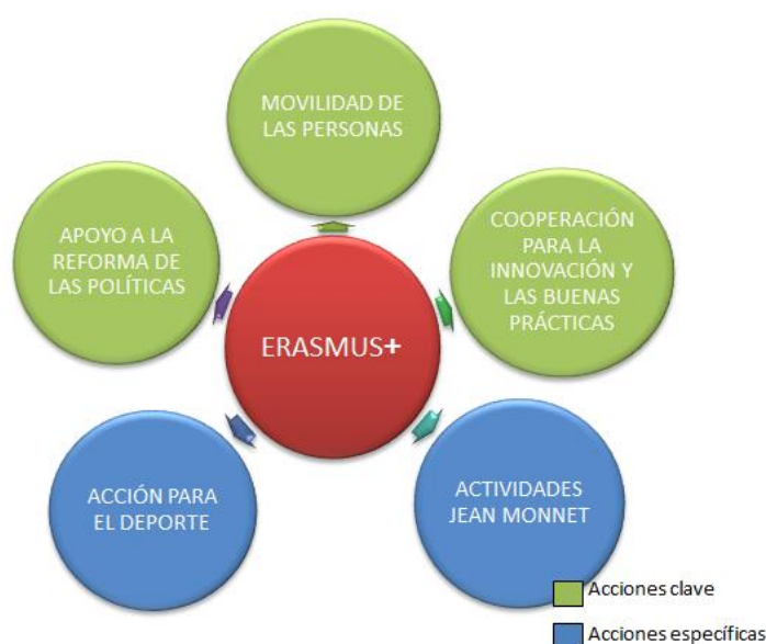
Figura 2. Acciones de Erasmus+ (Elaboración propia).

Las acciones a través de las que se desarrolla el programa son cinco, detalladas en la figura 2, de las cuales tres son acciones clave y dos son acciones específicas. En las tres acciones clave se integran los programas sectoriales del antiguo Programa de Aprendizaje Permanente, los programas internacionales de educación superior y Juventud en Acción (Susanu, 2014).