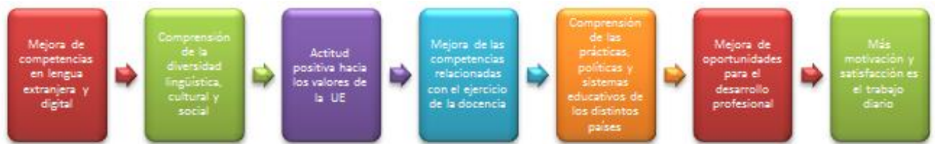
Figura 3. Resultados esperados de las asociaciones estratégicas (Elaboración propia).

que ofrecen interesantes herramientas, servicios en línea y oportunidades de colaboración virtual para docentes de todos los niveles, voluntarios y trabajadores del ámbito de la juventud de dentro y fuera de Europa. Estas plataformas incluyen el eTwinning, la Plataforma electrónica para el aprendizaje de adultos en Europa (EPALE) y el Portal Europeo de la Juventud. Para la Educación Primaria estas acciones se circunscriben a asociaciones estratégicas para la cooperación entre instituciones escolares. Los proyectos pueden ser desarrollados por dos o más centros (en otros niveles educativos el mínimo para una asociación estratégica es de tres socios) y los proyectos deben contemplar algún aspecto de las prioridades europeas en materia de educación, es decir, abandono escolar, mejora de lenguas extranjeras, adquisición de competencias básicas, etc. (European Commission, 2014 a).