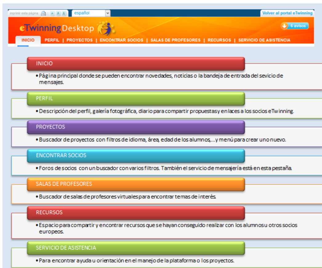
Figura 6. Detalle y descripción de la barra de tareas del escritorio de la plataforma eTwinning (Elaboración propia).

Sería necesario que el contacto con los socios se planifique con la suficiente antelación como para poder dedicarse cuanto antes a la organización de actividades. La primera acción a llevar a cabo es plantear a los socios participantes de otros centros educativos un cronograma y una propuesta de actividades con absoluta flexibilidad y capacidad de adaptación para conseguir un alto grado de coordinación y compromiso. Es imprescindible considerar los diferentes calendarios escolares de los distintos países participantes a la hora de elaborar el cronograma, este es un defecto común que dificulta la marcha de muchos proyectos eTwinning.