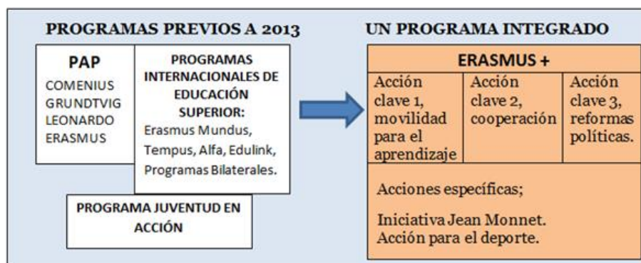
Figura 4. Comparativa entre Erasmus+ y los programas previos (Elaboración propia).

Resumiendo, las novedades más destacadas de Erasmus+ son el paso a un solo programa con tres ámbitos (educación y formación, juventud y deportes) como se puede ver en la comparativa de la figura 4, la vinculación entre el programa y los objetivos políticos europeos y la generalización del uso de las plataformas virtuales tipo eTwinning. Además, Erasmus+ incrementa su presupuesto en un 40% respecto al Programa de Aprendizaje Permanente (European Commission, 2014 b).