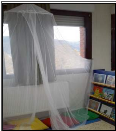
Imagen 2: En esta imagen, se visualiza como se pretende hacer la reestructuración, dejando los puntos fuertes como el lugar (luminoso) en el que se encuentra y la estantería. Se crea un espacio agradable para la lectura mediante una alfombra, cojines y una mosquitera.

Este material ha sido una aportación personal por iniciativa propia de la profesora del aula, ya que han supuesto cambios con un coste económico bajo.