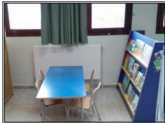
Imagen 1: En esta imagen se puede ver la biblioteca del aula de 4 años. Situada en un lugar luminoso y con una estantería a la altura del alumnado, en la que los libros están colocados con la tapa hacia afuera para que los niños puedan verla fácilmente.

Por otro lado, se decide dejar el rincón en el mismo espacio, ya que se encuentra junto a la ventana, aportando al espacio suficiente claridad. Se valora como apropiada la estantería, un mueble con características adecuadas, ya que permite a los niños alcanzar los libros de forma autónoma.