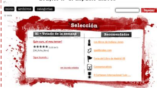
Gráfico n° 2: Espacio Libros