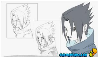
Gráfico nº 9: ¿Cómo dibujar?

Una breve explicación: empezamos con el esquema básico, muy importante a la hora de dibujar personajes manga y anime. La colocación de la cruz que corresponde a ojos-nariz es muy importante. Sauku se encuentra en vista 3/4, es decir un medio perfil, por eso la colocamos a un lado de la cabeza, del lugar donde se coloque esto dependerá hacia donde mire nuestro personaje.