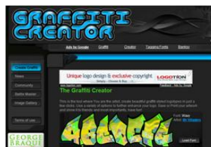
Gráfico nº 10: GraffitiCreator