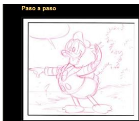
Gráfico nº 8: Aprende a dibujar