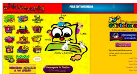
Gráfico n° 3: Chicomania.com