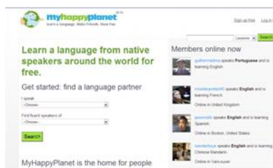
Gráfico n° 6: My happy planet