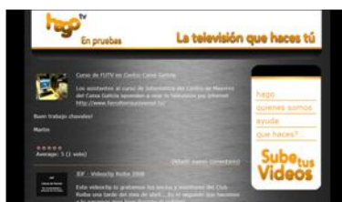
Gráfico nº 7: Hago TV