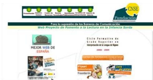
Gráfico n° 5: Lengua de signos española