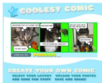
Gráfico n° 4: Creación de cómics online