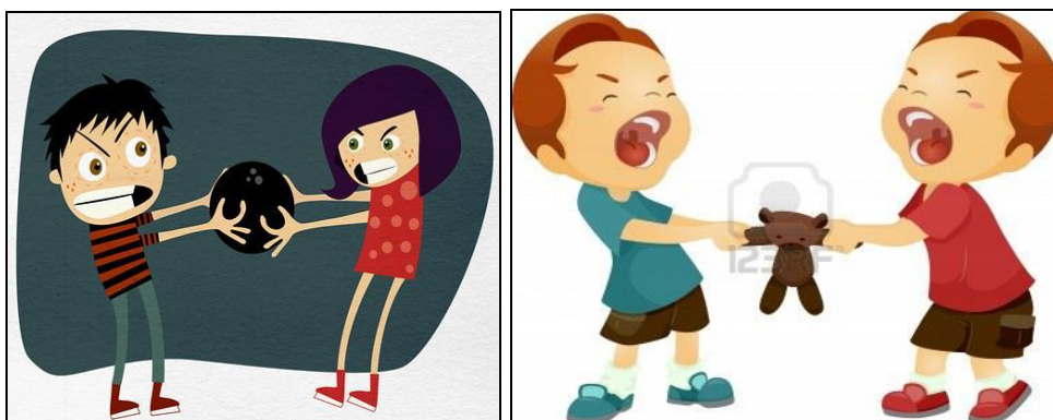
Figura 7 Valoramos nuestras acciones

Competencias emocionales a desarrollar: Identificación de conflictos que requieran soluciones y decisiones identificando riesgos y barreras.