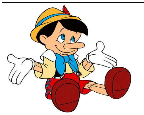
Figura 6 Armamos una marioneta.

Desarrollo: Se presentará una marioneta con una figura muy conocida de los cuentos infantiles, se trata de Pinocho.