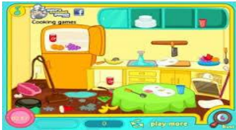
Figura 5. Limpiamos la cocina