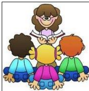
Figura 1: Posición de la maestra en la lectura