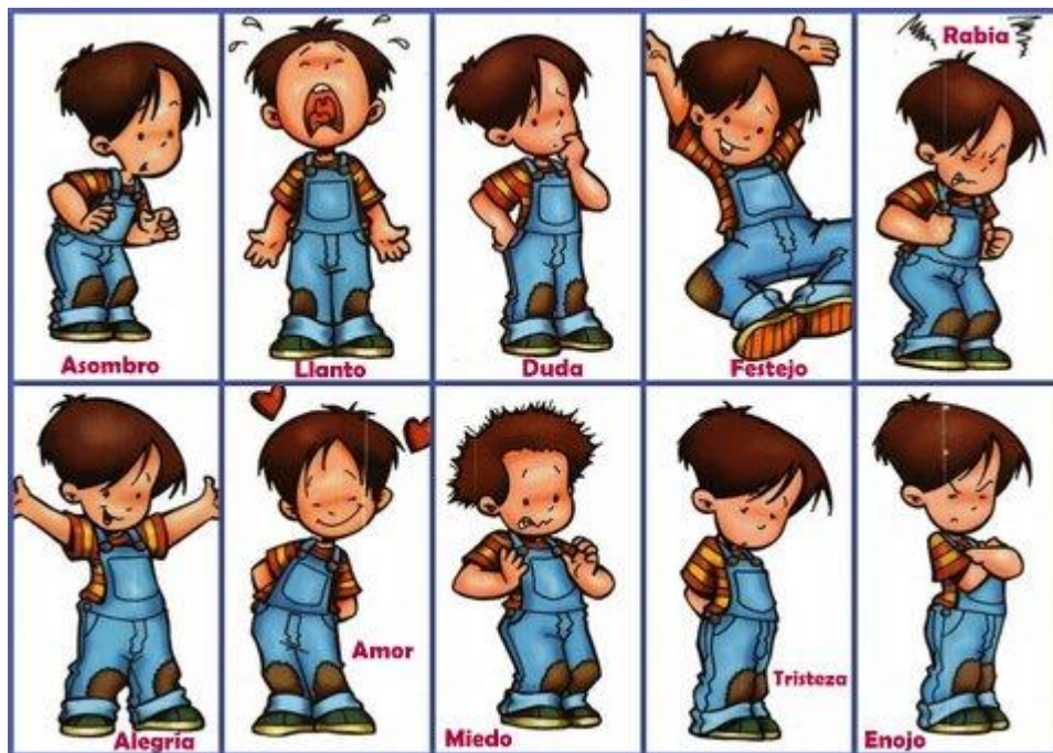
Figura 2 Reconociendo las emociones