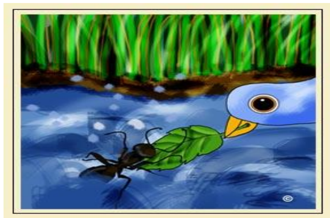
Figura 4 La hormiga y la Paloma

Desarrollo: Para esta actividad se propone la narración de un cuento titulado “La hormiga y la paloma”.