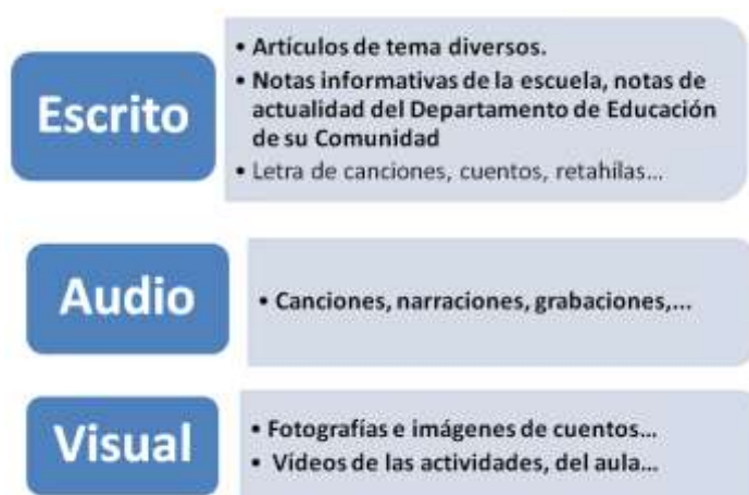
Figura 1: Información del Rincón de las familias

Por lo tanto, la información que podrán encontrar los padres, madres o tutores legales de los niños y niñas será diversa y puede estar en diferentes formatos. A modo de síntesis: