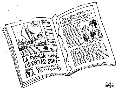
Imagen 5. Mingote, Abc , 7-9-1975, p. 3

siguiente (La página anterior ha sido suprimida por prescripción ministerial)» 34 (ver imagen 5).