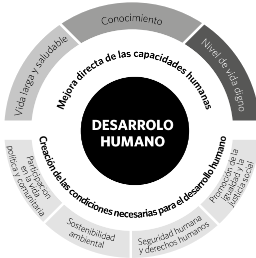
Figura 1. Dimensiones del desarrollo humano.