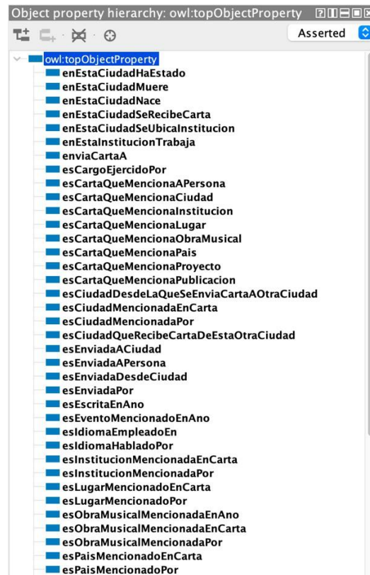
Figura 7. Ontología SCORE. Propiedades de objeto (fragmento).