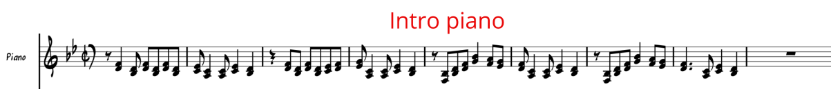
Figura 30 Introducción Piano.

En cuanto estructura, Intro – AB – Interludio – AB – C – Sección de solos – puente – B – Interludio final , el arreglo inicia con una sección de 8 compases a piano solo que emula la textura percusiva y resonante de la marimba de chonta, inspirada en versiones tradicionales de Kilele . En esta versión, las melodías originales fueron adaptadas al piano, manteniendo la esencia tímbrica y rítmica del estilo, en donde esta sección, introduce el ambiente sonoro de la obra (ver figura 30).