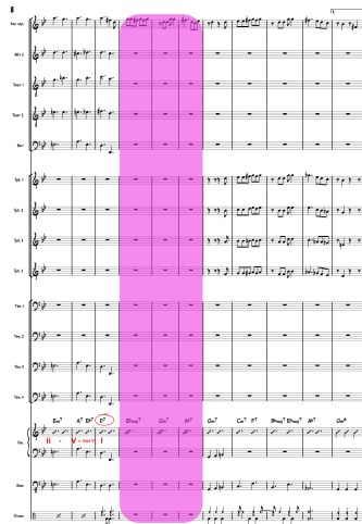
Figura 23 Cambio de textura.